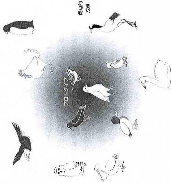
図1 「鳥」という概念の段階性

図1では、一番内側に原型的 (prototypical) な鳥が来て、外側にいくにしたがって典型的でない鳥になります。スズメやハト、カラスなど、日常よく見かける鳥が内側に来ていますね。一方、フクロウやワシなど、日常あまり見かけない鳥は外側に来ています。また、ペンギンやニワトリなど、空を飛べ