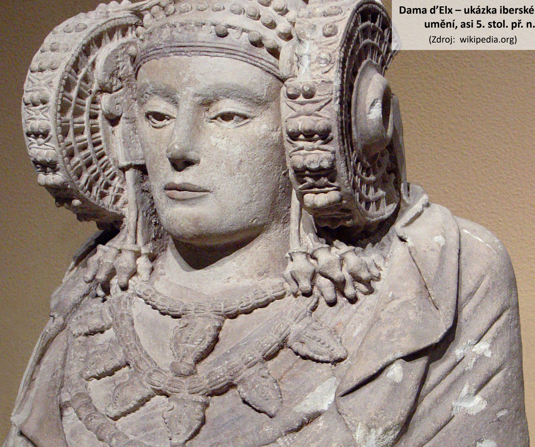
Dama d'Elx – ukázka iberského umění, asi 5. stol. př. n. l.