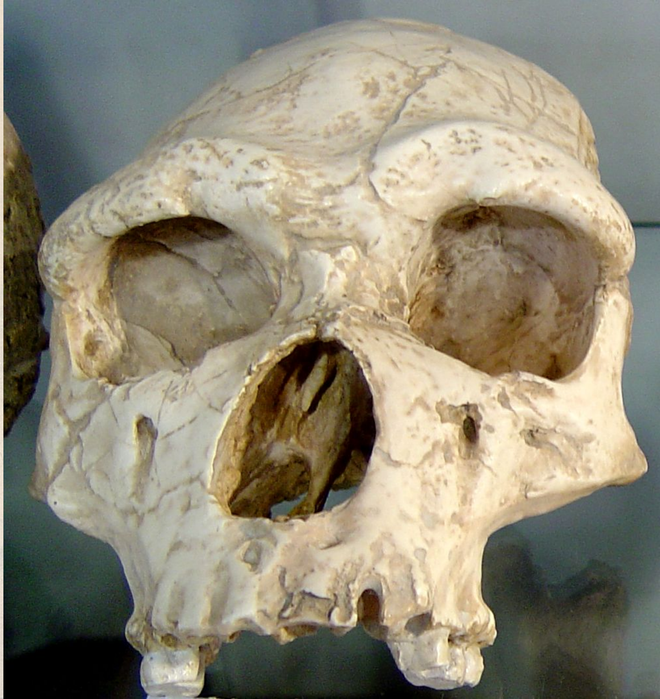
Lebka člověka z Talteüll