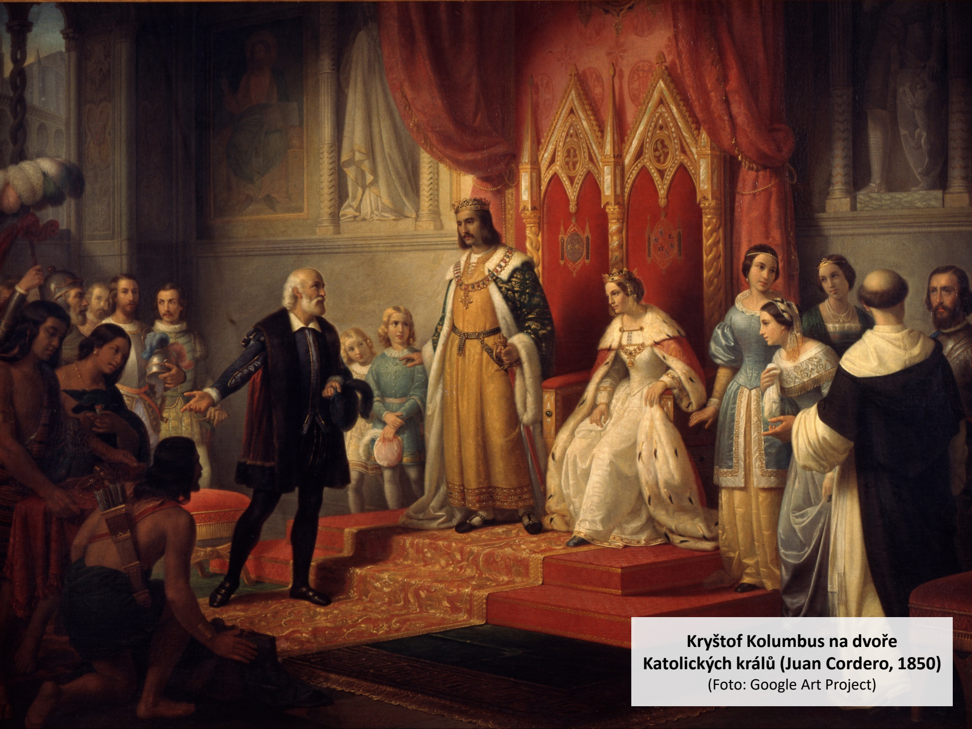
Kryštof Kolumbus na dvoře Katolických králů (Juan Cordero, 1850)