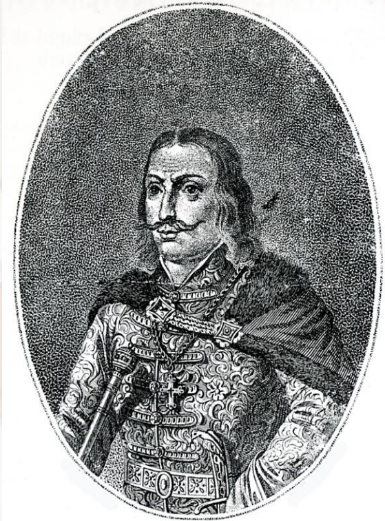
János Hunyadi (1387-1456)