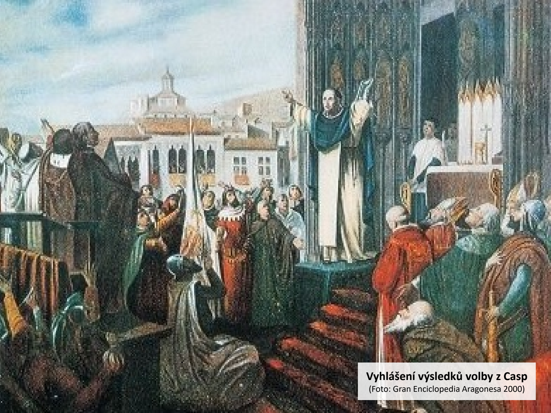
Vyhlášení výsledků volby z Casp