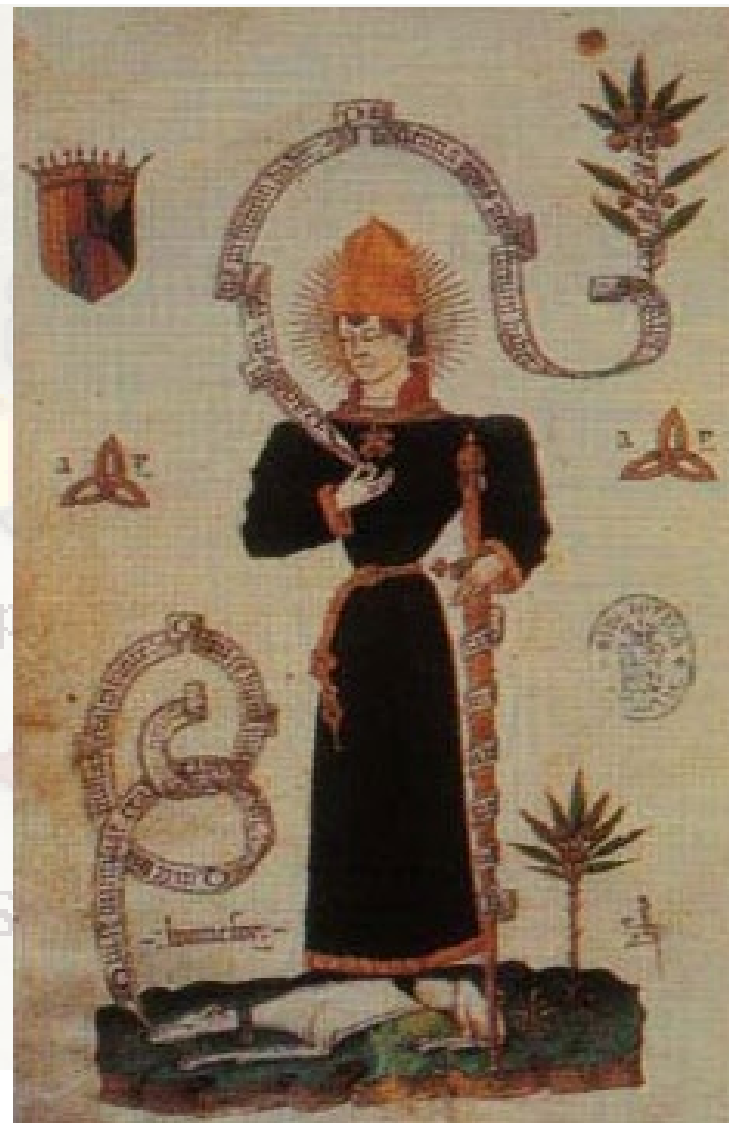
Carles de Viana

1460 se vrátil do Katalánska a Navarry, kde měl být v pozici místokrále (Katalánsko) a krále (Navarra) → opět zavřen. Propuštěn až na základě rozhodnutí katalánských Corts → slavnostně přijat v Barceloně jako místokrál (katalánské elity neměly Joana II rády).