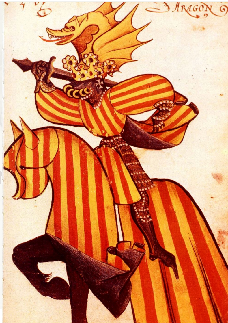
Alfons el Magnànim – jedno z mnoha ztvárnění

Casa d'Àustria (els Habsburg) (1516-1700/1714)