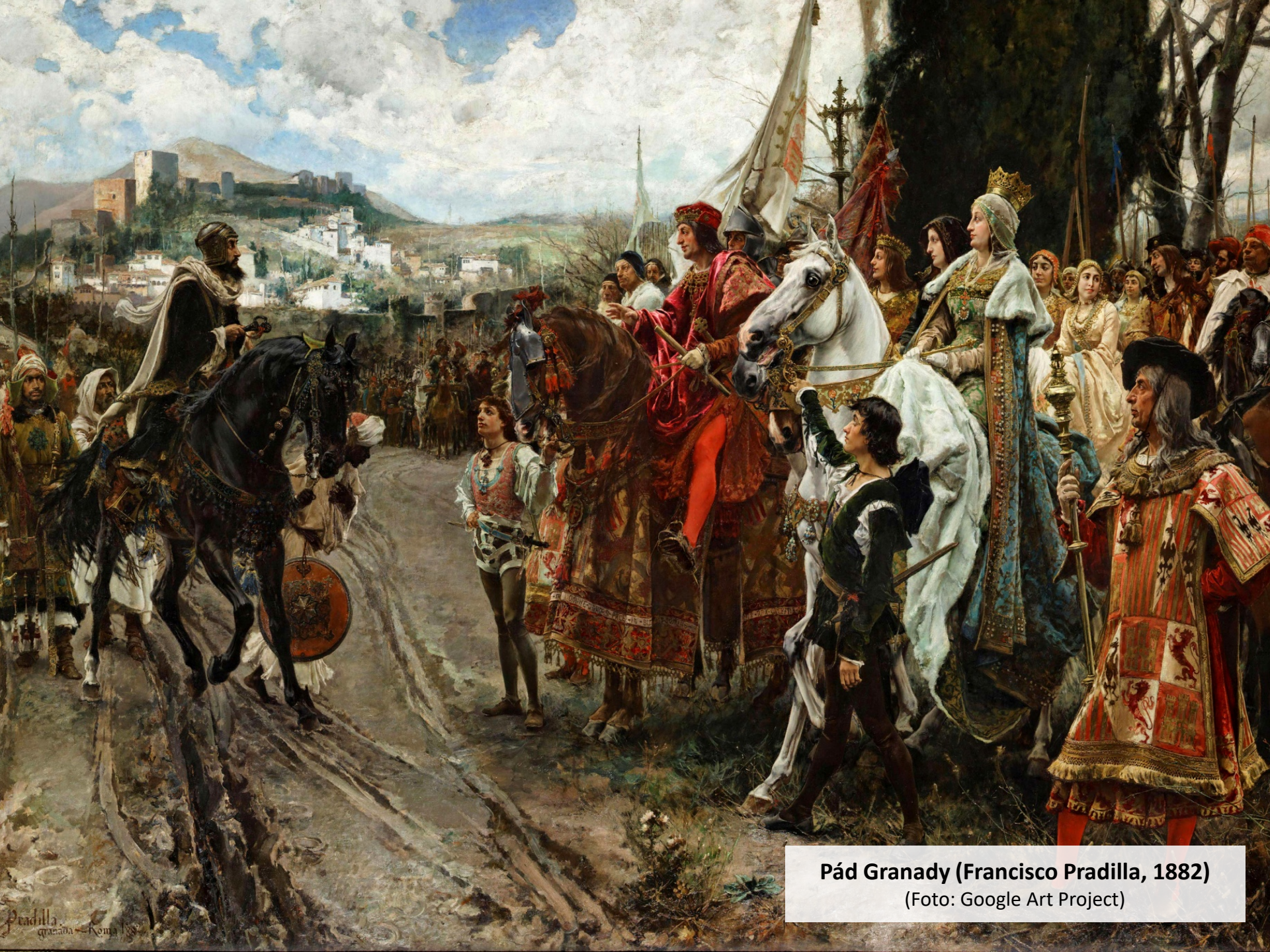
Pád Granady (Francisco Pradilla, 1882)