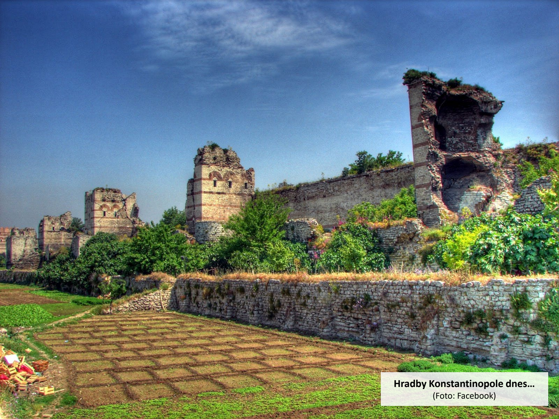
Hradby Konstantinopole dnes...