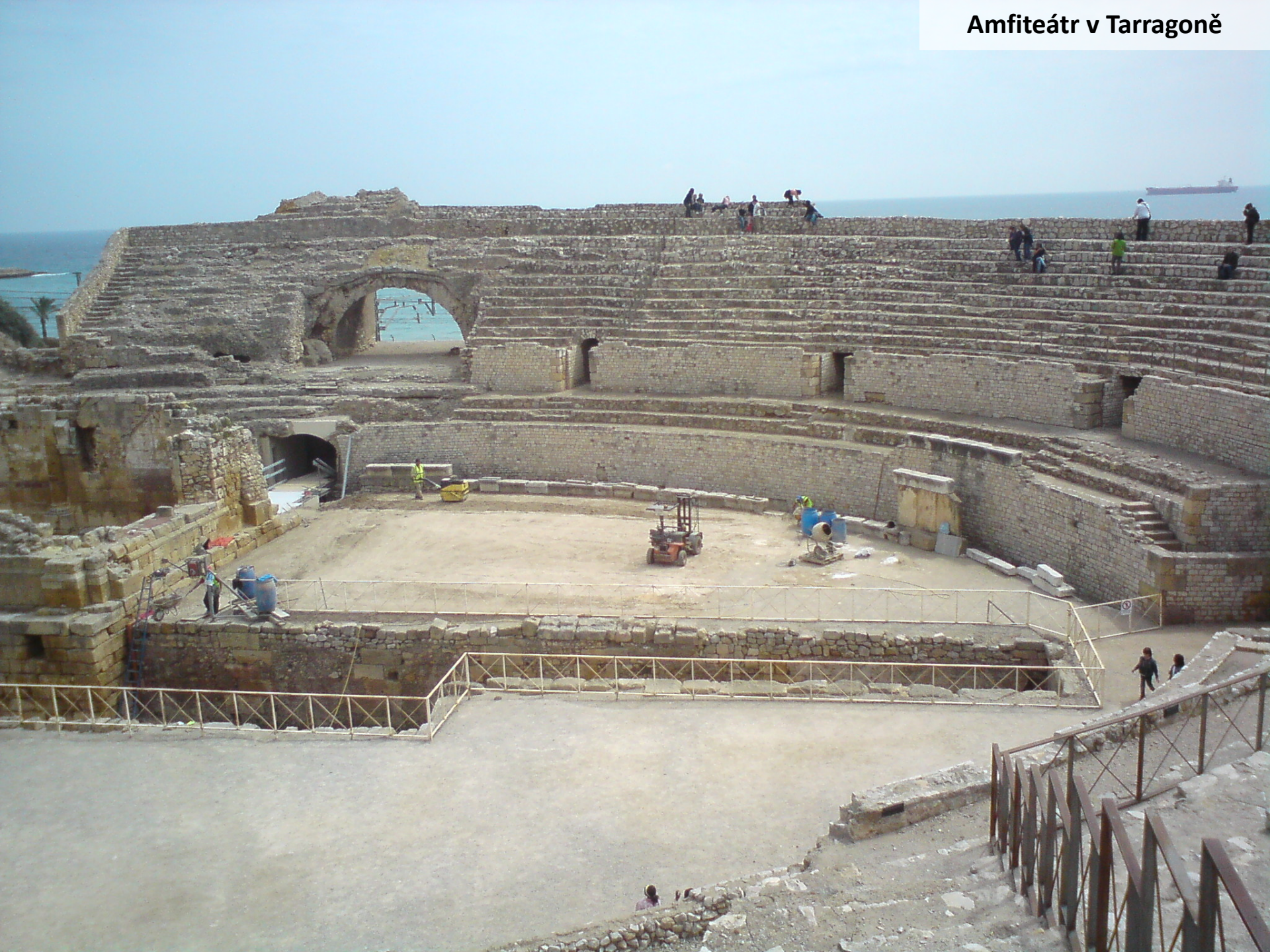
Amfiteátr v Tarragoně