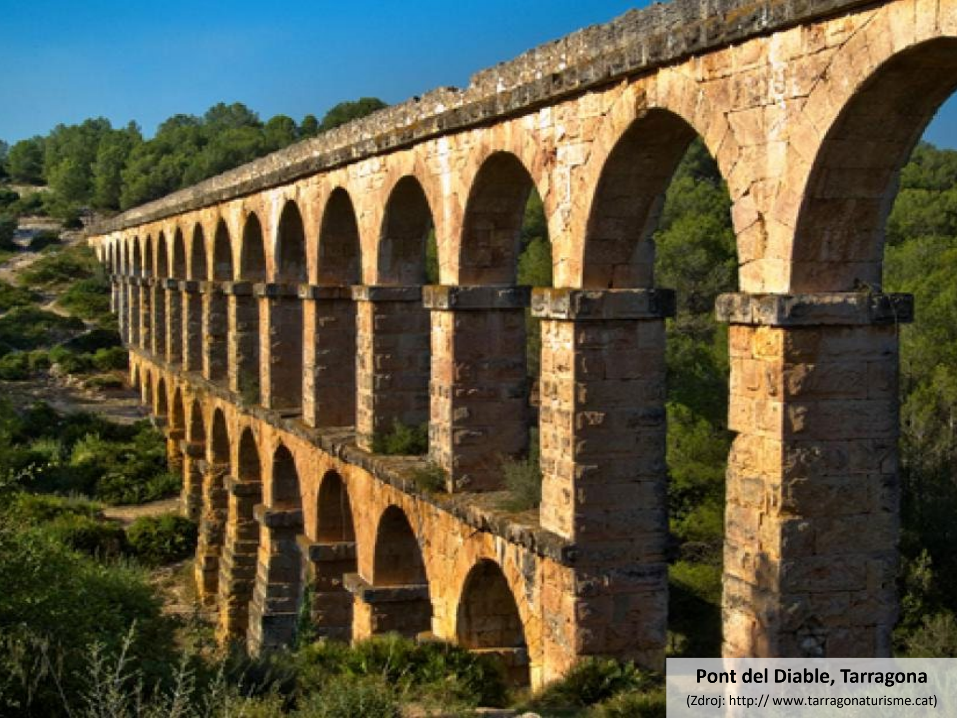
Pont del Diable, Tarragona