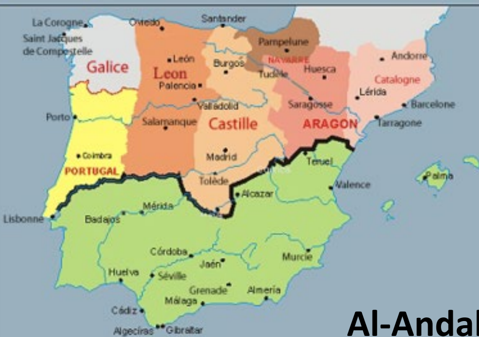
Al-Andalus en 1150