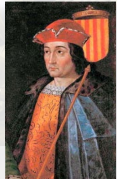
Ramon Berenguer IV.