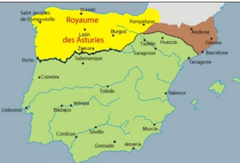
Al-Andalus en 790