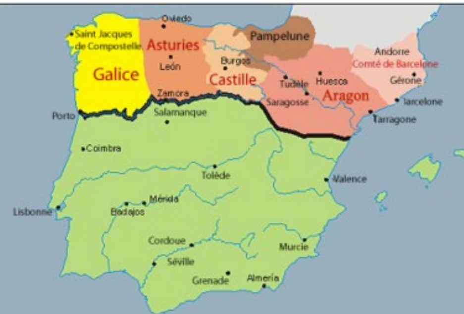
Al-Andalus en 900