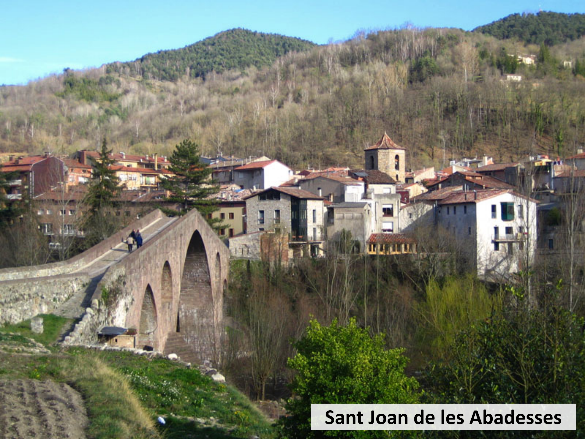
Sant Joan de les Abadesses