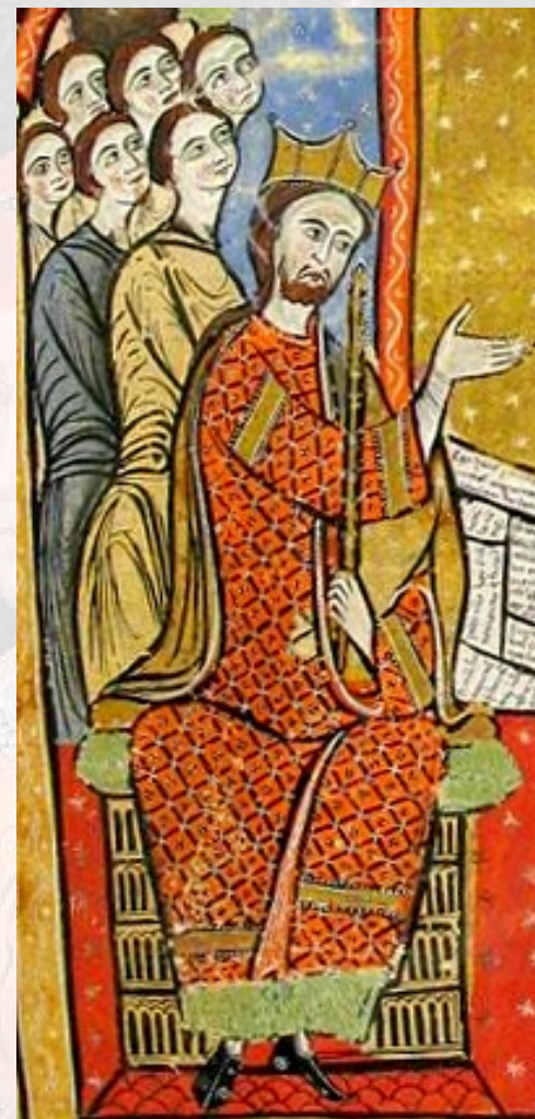
Liber feudorum maior