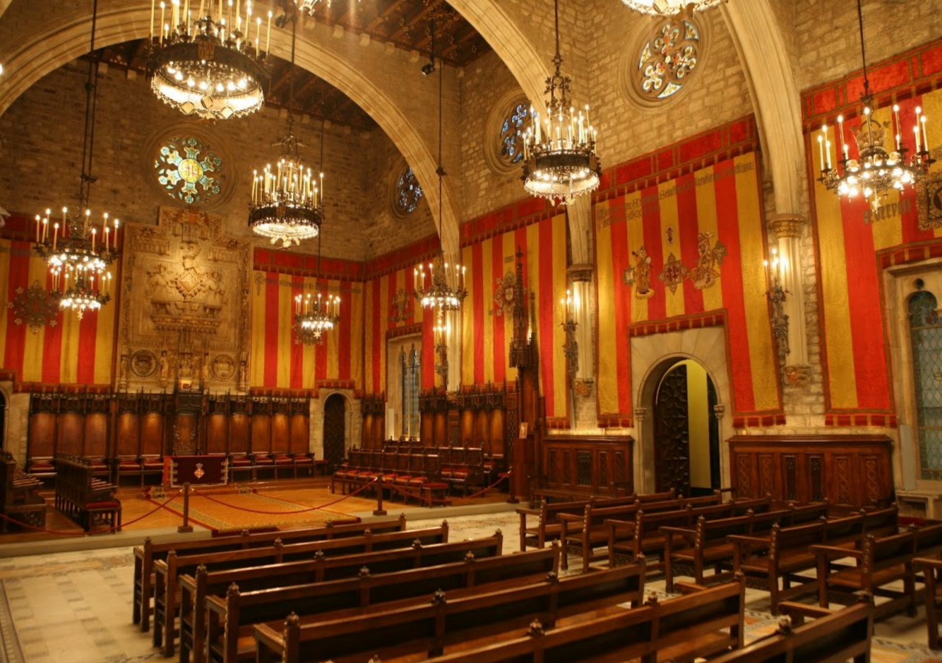
Saló de Cent, Ajuntament de Barcelona