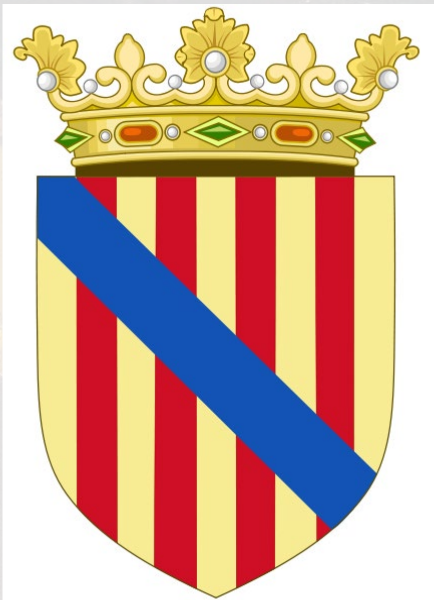
Znak Mallorského království