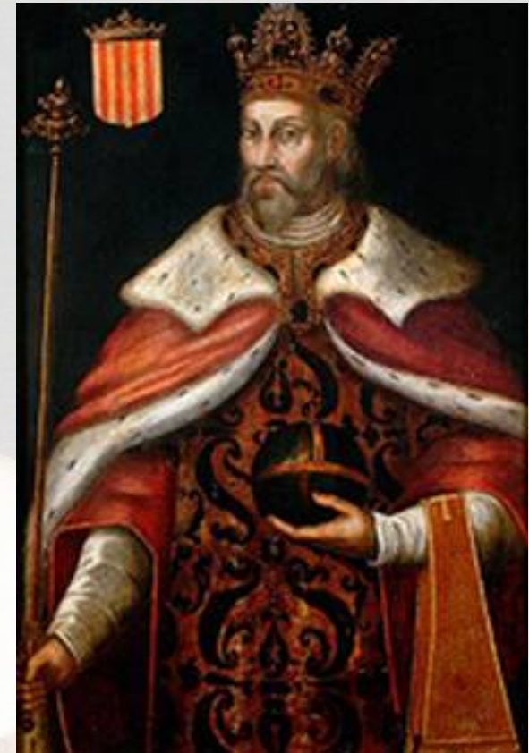
Pere el Gran