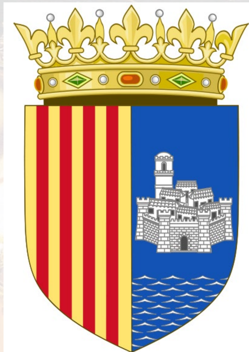
Znak Valencijského království