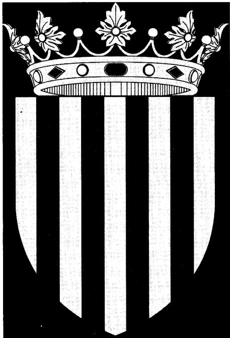
Znak aragonského království

ven 1120), kde Alfons rozdrtil almorávidskou armádu na čele s Ibrahímem ibn Júsem. Za třicet let Alfonsovy vlády se aragonské teritorium celkově zdvojnásobilo. Na Alfonsových úspěších nic podstatného nemění fakt, že se mu nepovedl závěr vlády, kdy nezvládl úplně poslední bitvu své předlouhé válečnické kariéry. Došlo k tomu u obce Fraga, asi 50 kilometrů od katalánské Léridy, a zdá se, že Alfons tehdy hrubě podcenil své méně početné muslimské soupeře, takže byl donucen k potupnému útěku do Zaragozy. O pár dnů později unavený a pokořený monarcha zemřel. Bohužel bezdětný, protože z jeho svazku s kastilskou princeznou Urracou žádné děti nevzešly. Zklamáný král dokonce pod záminkou neplodnosti královnu v roce 1114 zapudil, což vztahy mezi Aragonií na jedné a Kastilií a Leónem na straně druhé značně poškodilo. Stojí určitě za zmínku, že problém s fertilitou byl ve skutečnosti zřejmě na straně velkého bojovníka, protože Urraca s jinými