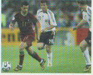
GUARDARE UNA PARTITA DI CALCIO

Nel tempo libero, nei giorni e nelle ore libere dal lavoro, possiamo fare diverse attività interessanti.