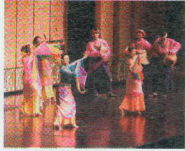
VEDERE UNO SPETTACOLO TEATRALE