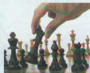
GIOCARE A SCACCHI

4. Guarda le fotografie e poi raggruppa le attività. Puoi aggiungere anche altre attività.