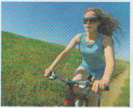
FARE UN GIRO IN BICI