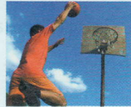
GIOCARE A PALLACANESTRO