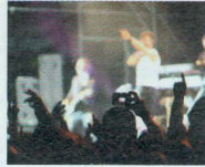
ASCOLTARE UN CONCERTO