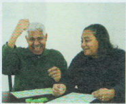
GIOCARE A TOMBOLA (A BINGO)