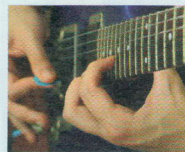
SUONARE UNO STRUMENTO