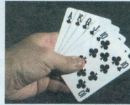
GIOCARE A CARTE