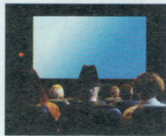
VEDERE UN FILM AL CINEMA