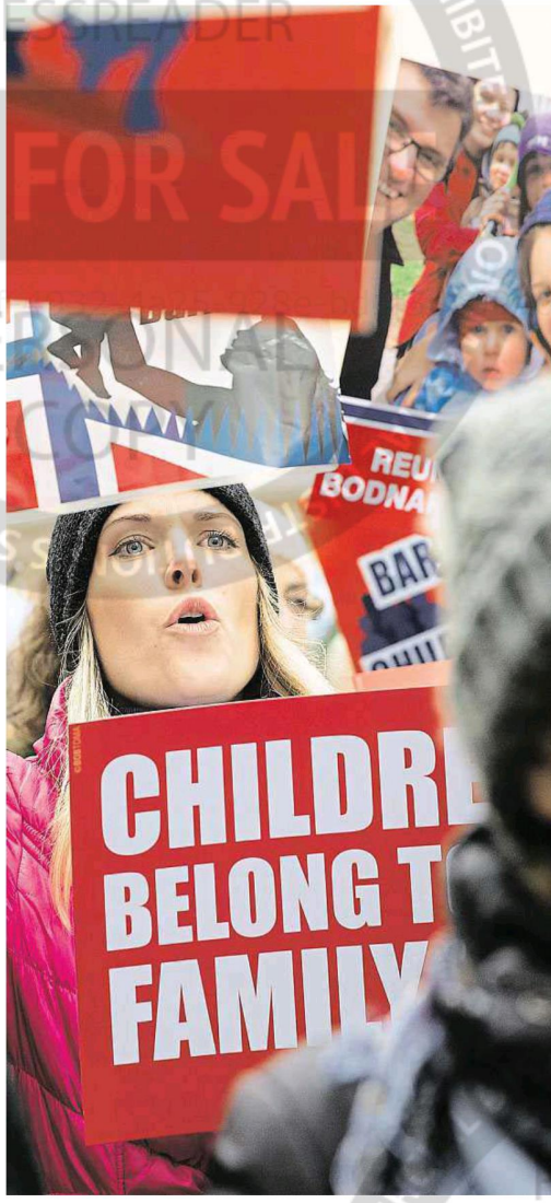
Z demonstrace proti Barnevernetu v Praze 16. ledna 2016