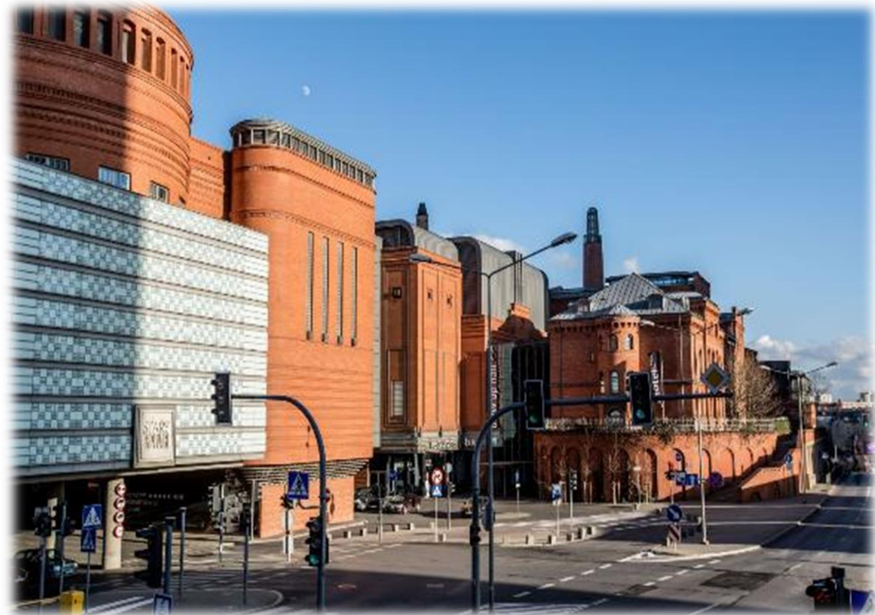
Stary Browar w Poznaniu