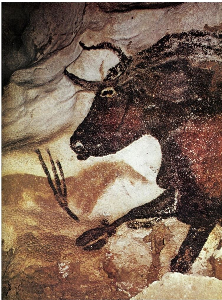
Fragment skalních maleb z jeskyně Lescaux (Francie)