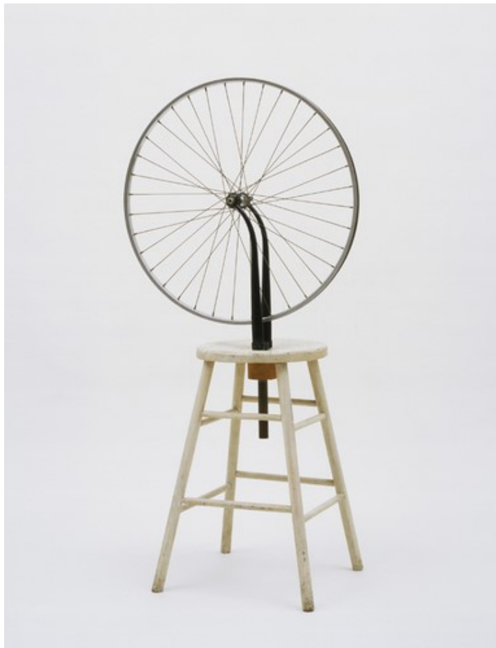
Marcel Duchamp, Kolo z bicyklu , 1913