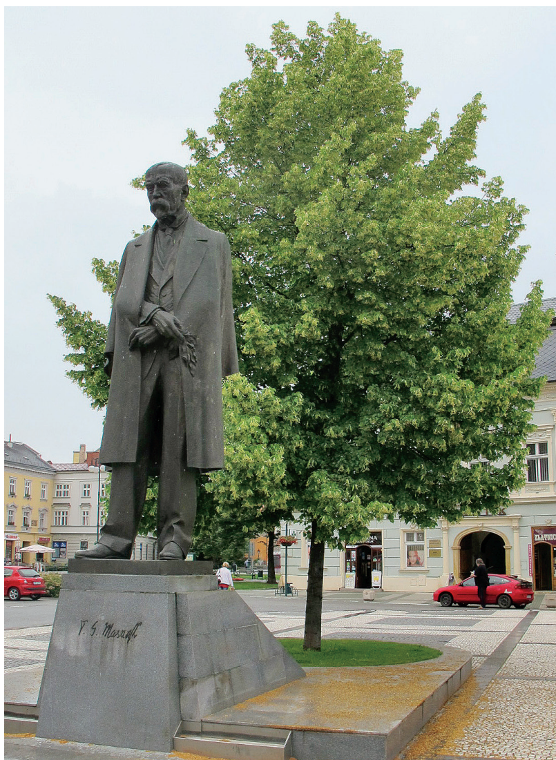
Replika původní sochy byla odhalena v roce 1998