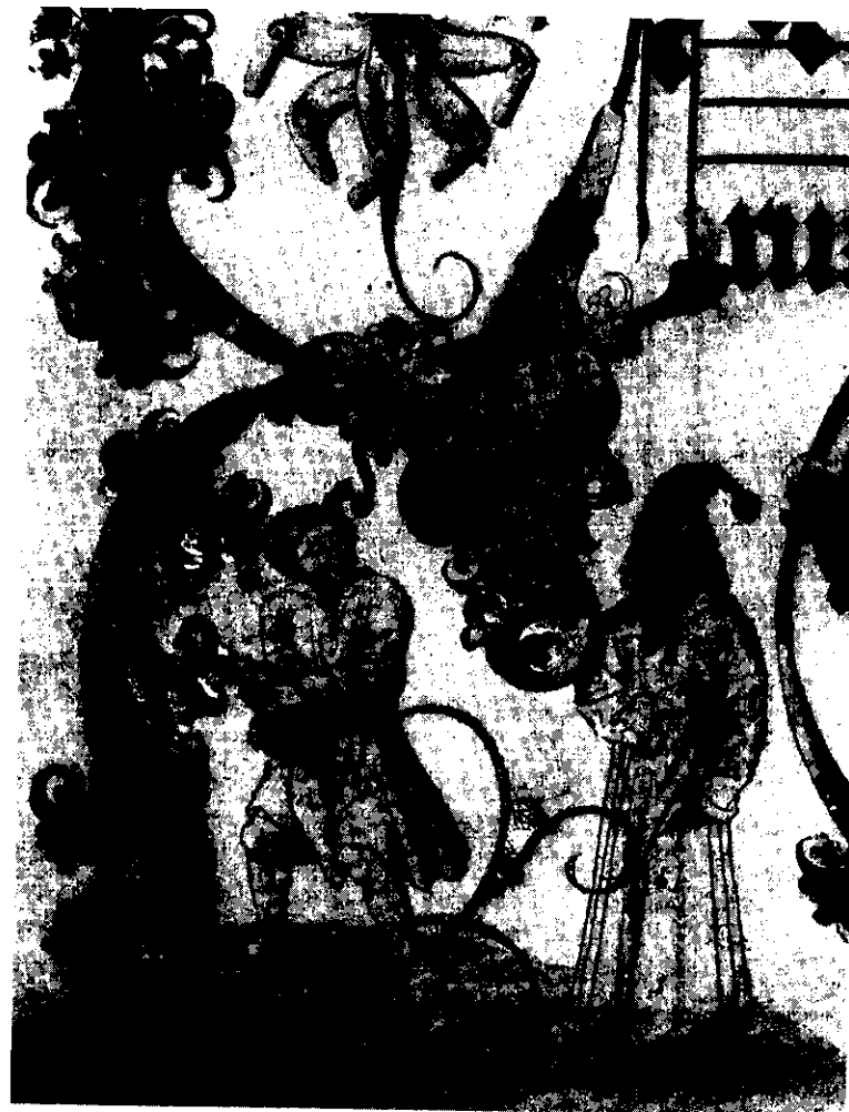
83. Dva šašci.

Nepoctivé úmysly i činy se nejlépe zatají v davu, a to snadněji na