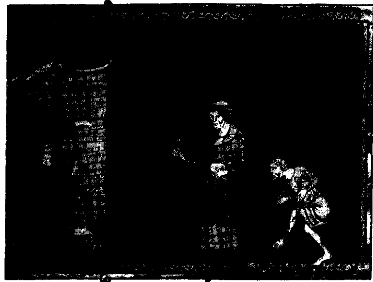
84. Mrzák a nemocný leprou.

Na rozdíl od jednotlivých případů dráždících představivost koloritem a kulisami středověkého podsvětí, působí strohá statistika kriminálních deliktů sice šedivě, avšak o to více odráží skutečný stav věci. Nedávno zveřejněný výzkum kriminality v Olomouci od poloviny 14. století do roku 1420 zahrnul celkem 447 případů, z nichž více než polovinu tvořilo zabití (55 %). Co do početnosti následovaly zranění (15 %) a krádeže (9 %). Celé tři čtvrtiny pachatelů pocházely z Olomouce a jeho předměstí, přičemž naprostá většina z nich patřila k měšťanům různé zámožnosti i profese nebo k selskému obyvatelstvu blízkého okolí. Jen 36 osob se dopustilo několikanásobné trestné činnosti, z čehož plyne, že olomoucké podsvětí nebylo zvláště početné. V souladu s tím také 99 ze 162 známých pohnutek bylo ekonomické povahy, dosti běžným motivem pak byly osobní i politické rozepře, poměrně vzácné naopak byly delikty sexuální. Za povšimnutí také