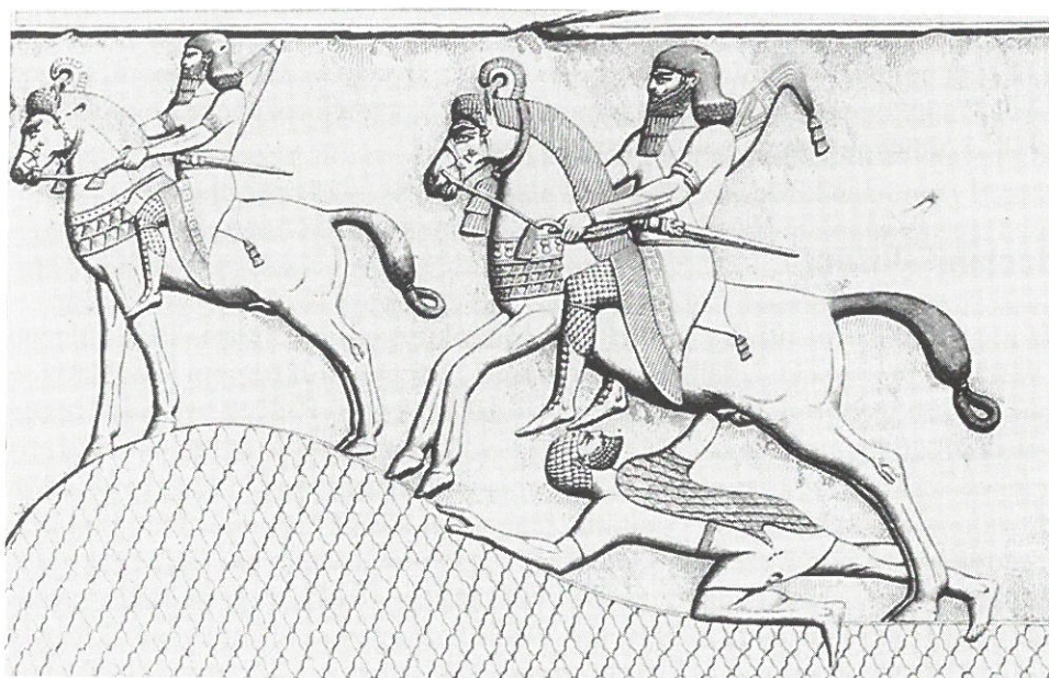
5. Jezdci na koních.

Soukromé domácnosti vlastnily jen malý počet otroků, což bylo částečně způsobeno specifickým charakterem vztahu otroků k vlastníkovi a částečně také nedostatkem zájmu o domácí průmyslovou výrobu, jež byla charakteristická pro obyvatele řeckých měst. Podobná výroba se na Předním východě