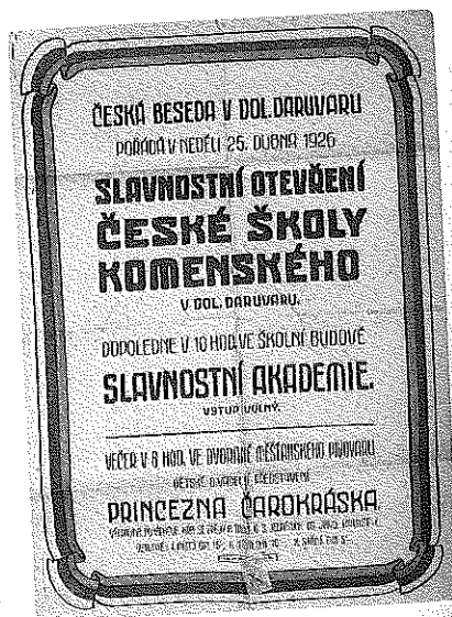
Otevření České školy v Dolním Daruvaru v roce 1926

Většina zdejších Čechů se hlásila k římskokatolickému náboženství. Roku 1910 jich bylo 30 409, evangelíků augsburského vyznání bylo jen 479, reformovaných 589, k židovskému náboženství se hlásilo 77 Čechů. Většina Čechů - 72,9% mužů a 65,5% žen - byla gramotná. Podle povolání bylo 70% Čechů činných v zemědělství a 15% v průmyslu.