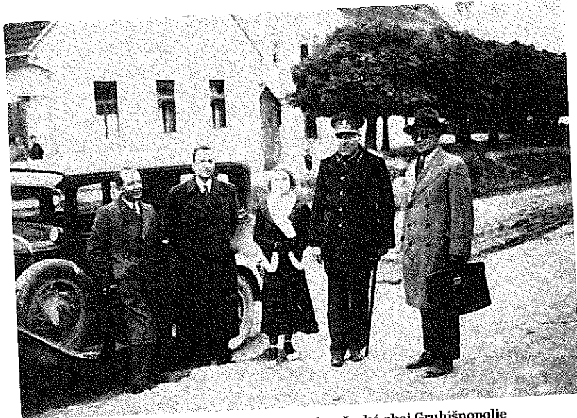
Snímek z návštěvy jugoslávského představitele v české obci Grubišnopolje