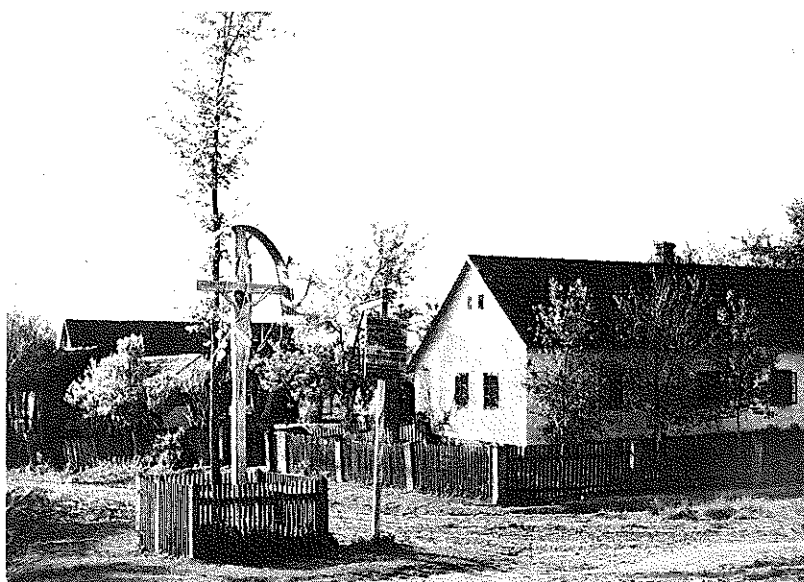
Lípa svobody ve Velkých Zdencích v roce 1935

Po převratu a zavedení nového administrativního dělení Jugoslávie spadali chorvatští Češi především do Sávské bánoviny. V národnostních sporech mezi Srby a Chorvaty stáli, zejména ti více asimilovaní, na straně Chorvatů a podporovali chorvatské politické strany. Chorvatští Češi, kteří chtěli být „živým koridorem“ mezi ČSR a Jugoslávií, přispívali k rozšíření odbytu čs. zboží v Jugoslávii. K pozitivům menšiny patřily píle, pracovitost, šetrnost, národní uvědomění její značné části, řada obětavých pracovníků, značný pozemkový majetek, moderní způsob hospodaření, stoupající počet inteligence, hojné styky s ČSR, průmyslové podnikání, zřizování družstev a peněžních závodů. Hospodářské a kulturní zájmy postupně sblížovaly českou menšinu také s jugoslávskými Slováky.