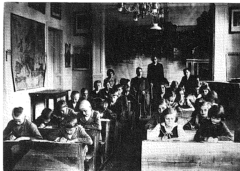
Česká škola v Bjelovaru