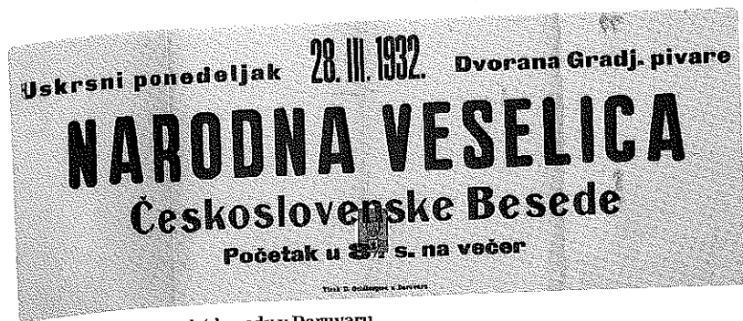
Plakát Československé besedy v Daruvaru

vyučovacím jazyce (kromě srbochorvatštiny a vlastivědy) a v 5. až 8. ročníku v srbochorvatském (kromě předmětu český jazyk). Soukromé školy finančně dotoval Spolek pro podporu čs. zahraničních škol Komenský v Praze, byli sem dislokováni učitelé z ČSR a odborný dozor vykonávalo čs. ministerstvo školství a národní osvěty. Učitelé z ČSR působili také na doplňovacích školách, jejichž úkolem bylo zabezpečovat výuku češtiny u českých žáků srbochorvatských škol. Vzhledem k nepovinnému charakteru těchto škol byla absence žáků, zvláště v letním období zemědělských prací, značná. Tyto typy škol zajišťovaly výuku mateřskému jazyku asi pro polovinu českých dětí v Jugoslávii. Zbývající děti neměly možnost této výuky buď pro malý počet příslušníků českého etnika v daném místě nebo pro nezáměr rodičů (např. v centru jugoslávských Čechů Daruvaru 160 českých dětí českou školu nenavštěvovalo). Do českých škol nechodilo celkem asi 1 800 českých dětí. V Daruvaru působila také česká soukromá mateřská škola a česká hospodářská škola, která pořádala i večerní zemědělské kurzy. Nepovinná výuka českého jazyka byla zavedena na daruvarském gymnáziu. Pro žáky českých škol byly pořádány prázdninové zájezdy do ČSR, stejně jako pro české učitele.