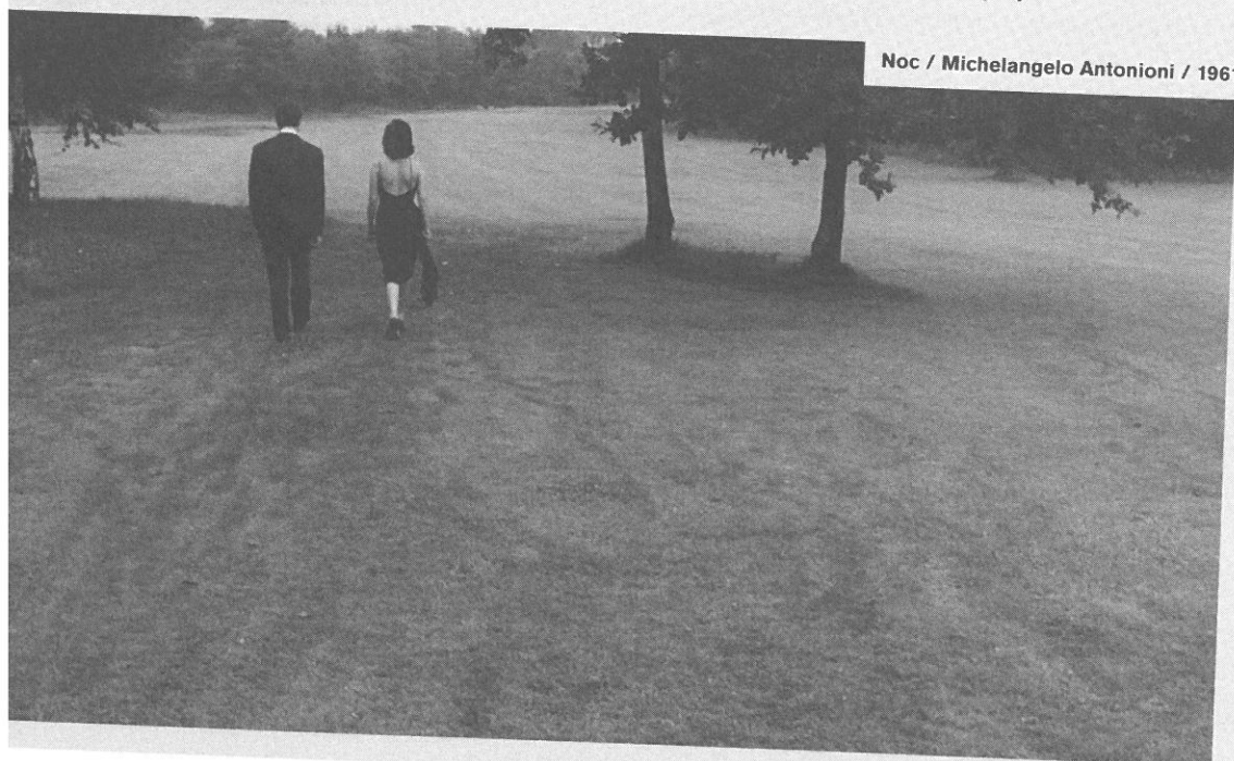
Noc / Michelangelo Antonioni / 1961

Recenze Kamila Fily se jmenuje „Tobruk tepe biologickým rytmem vojáka v zákopech“, je prožitková a vůči dílu vstřícnější: „Hrdinové Tobruku čelí prázdnotě horizontu pouště, která se před nimi rozprostírá do nekonečna, a utkávají se s tím, co se jim mele ve střevech a koluje v krvi. Film má skutečně zvláštní rytmus, který kopíruje fyziologické a mentální pochody vojáků. Rutinu, stereotyp a apatii střídá vzrušené očekávání a pokaždé má subjektivní vnímání času jinou povahu, přestože diváci obojí vnímají jako natažené.“ Nakonec Fila přejde do subjektivního tónu a zvýší hlas: „Na Tobruku mi v žádném případě nevadí, že nemá pevný děj, rychlý spád a postavy s jasně rozlišitelnými charakterem.“ S Hejdovou polemizuje: „Udivuje mě, kolik rádoby stříhačů si myslí, že by z filmu měla zmizet ta či ona scéna a že by tím vzniklo skvělé dílo. Tobruk se v pravém slova smyslu skví sám o sobě právě v té podobě, v jaké nyní je.“