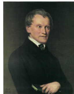
Johann Friedrich Böhmer (1795-1863)

Brněnské pobočka RI založená roku 2011 je nejmladším pracovištěm a zároveň první odnoží mimo Rakousko a Německo. Nachází se na Ústavu pomocných věd historických a archivnictví , ale oficiálně spadá pod Rakouskou akademii věd. Specializuje se na listiny císaře Zikmunda Lucemburského.