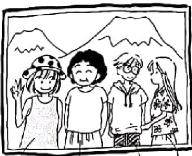
a. b. c. d.