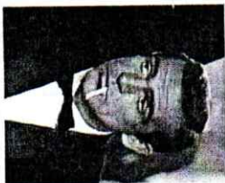
Sean Connery kao J. Bond