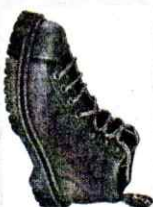
cipele Doc Martens