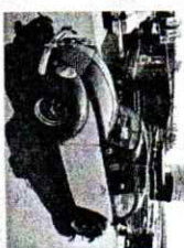
auto VW buba