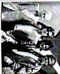
The Rolling Stones