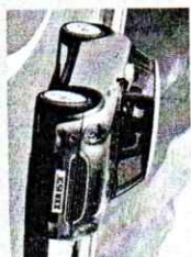
auto mini cooper

Ne sviđaju mi se tenisice All Star jer nisu kožne.