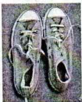
tenisice All Star