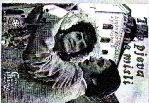
Najgledaniji hrvatski film 20. stoljeća je Tko pjeva, zlo ne misli . (scenarij i režija: Krešo Golik, 1970.)