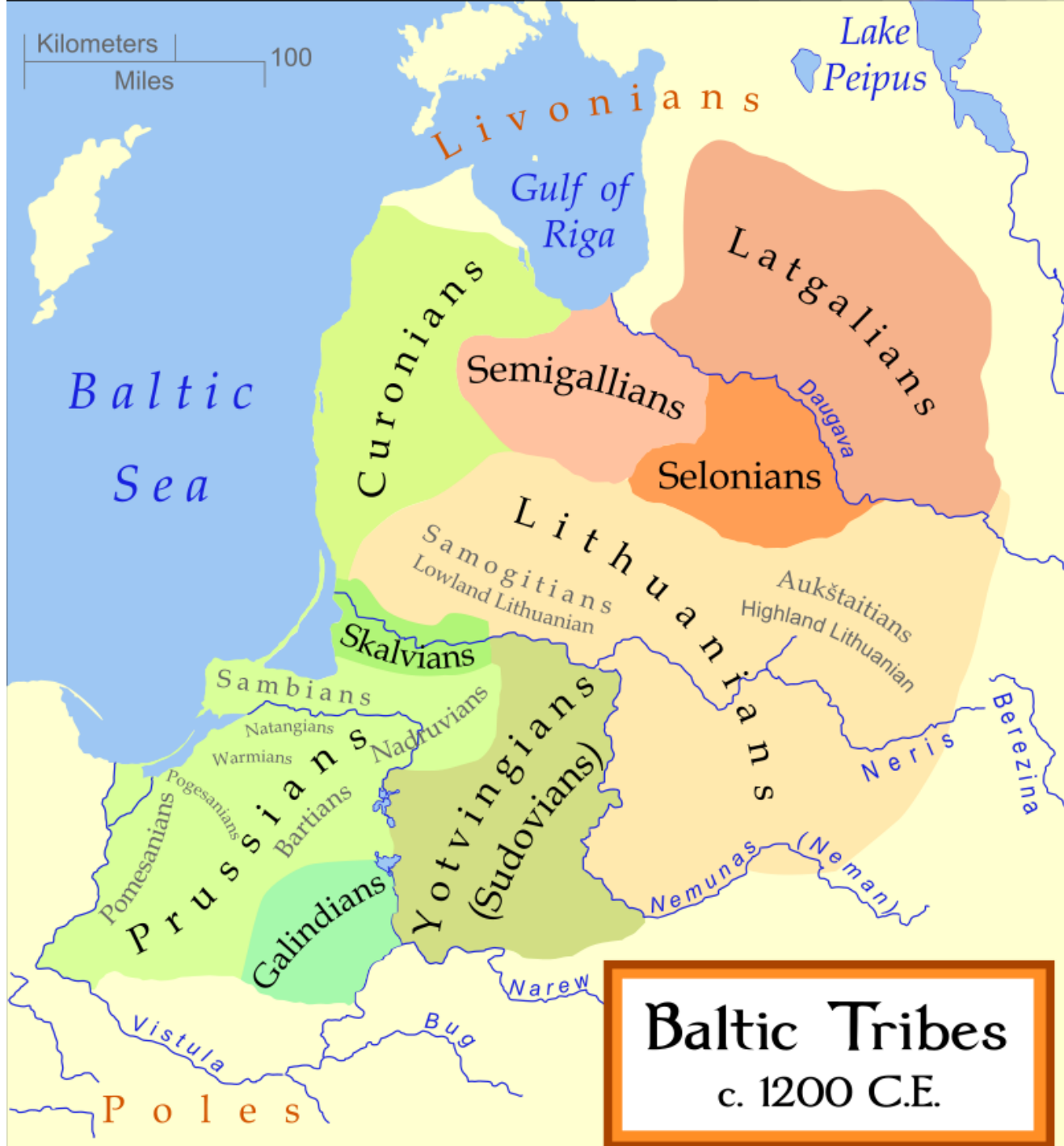
Baltic Tribes c. 1200 C.E.