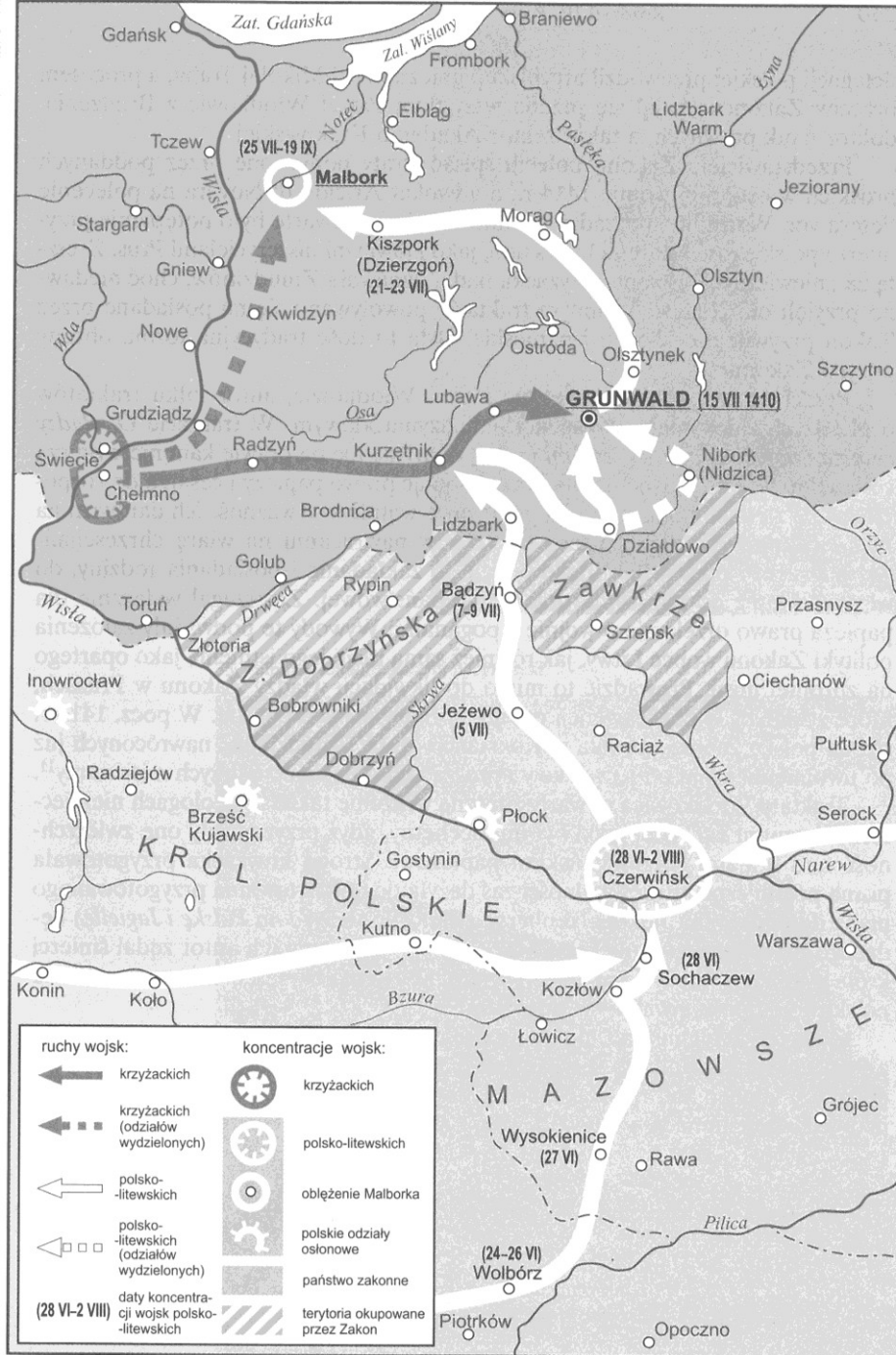
Mapa 12. Marsze wojsk polskich i litewskich pod Grunwald i na Malbork w 1410 r.