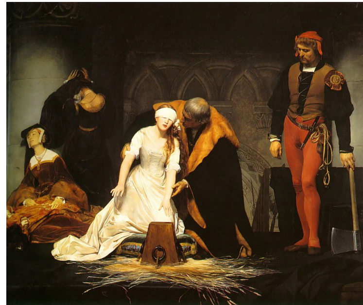
The Execution of Lady Jane Grey is an oil painting by Paul Delaroche