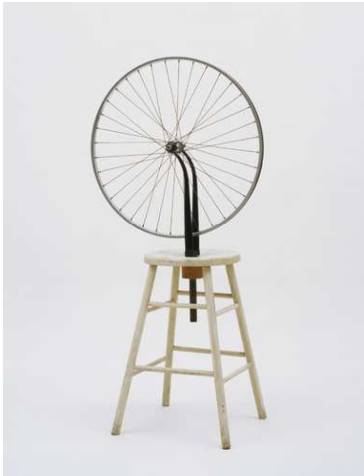
Marcel Duchamp, Kolo z bicyklu , 1913