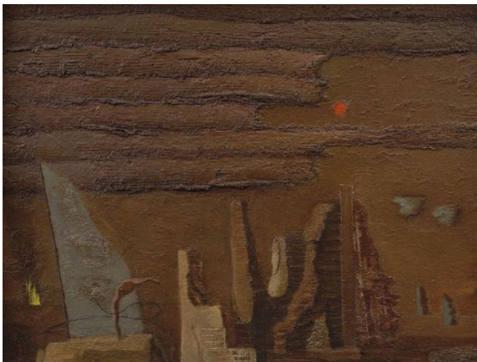
(Zdeněk Sklenář, Sutiny , olej, písek, 1945)