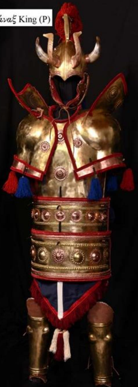
⊕ wa-na-ka φάναξ King (P)