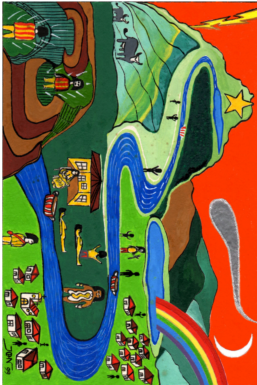
Dibujo 7: El nacimiento del Cacique

longitud de un mexicano, una victoria de ese tamaño" (voz páez). (Ver Dibujo 7).