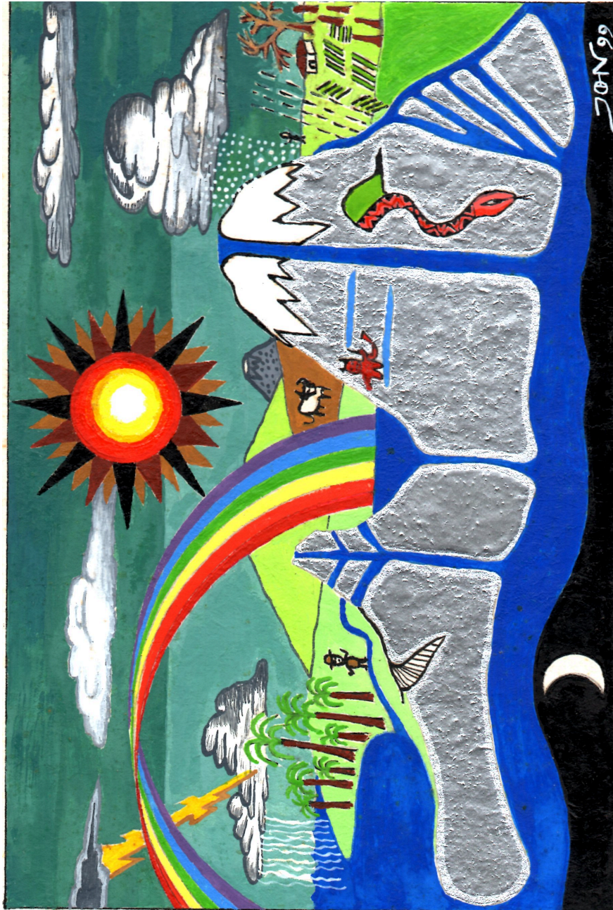
Dibujo 9: El agua está en todas partes