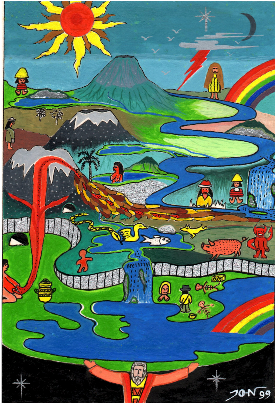
Dibujo 6 : Paisaje mítico Dibujo 6: Paisaje Mítico

En su cosmografía los tres mundos 25 configuran, a la manera de una red, la unidad del