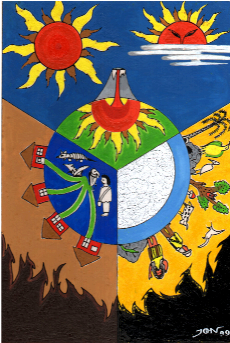
Dibujo 2: El origen del mundo páez