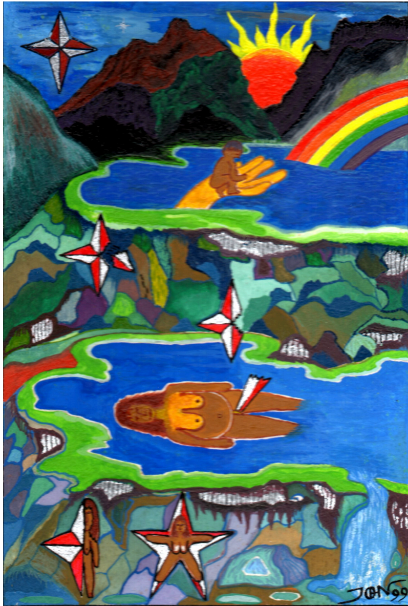
Dibujo 1: Los paeces, hijos de la estrella