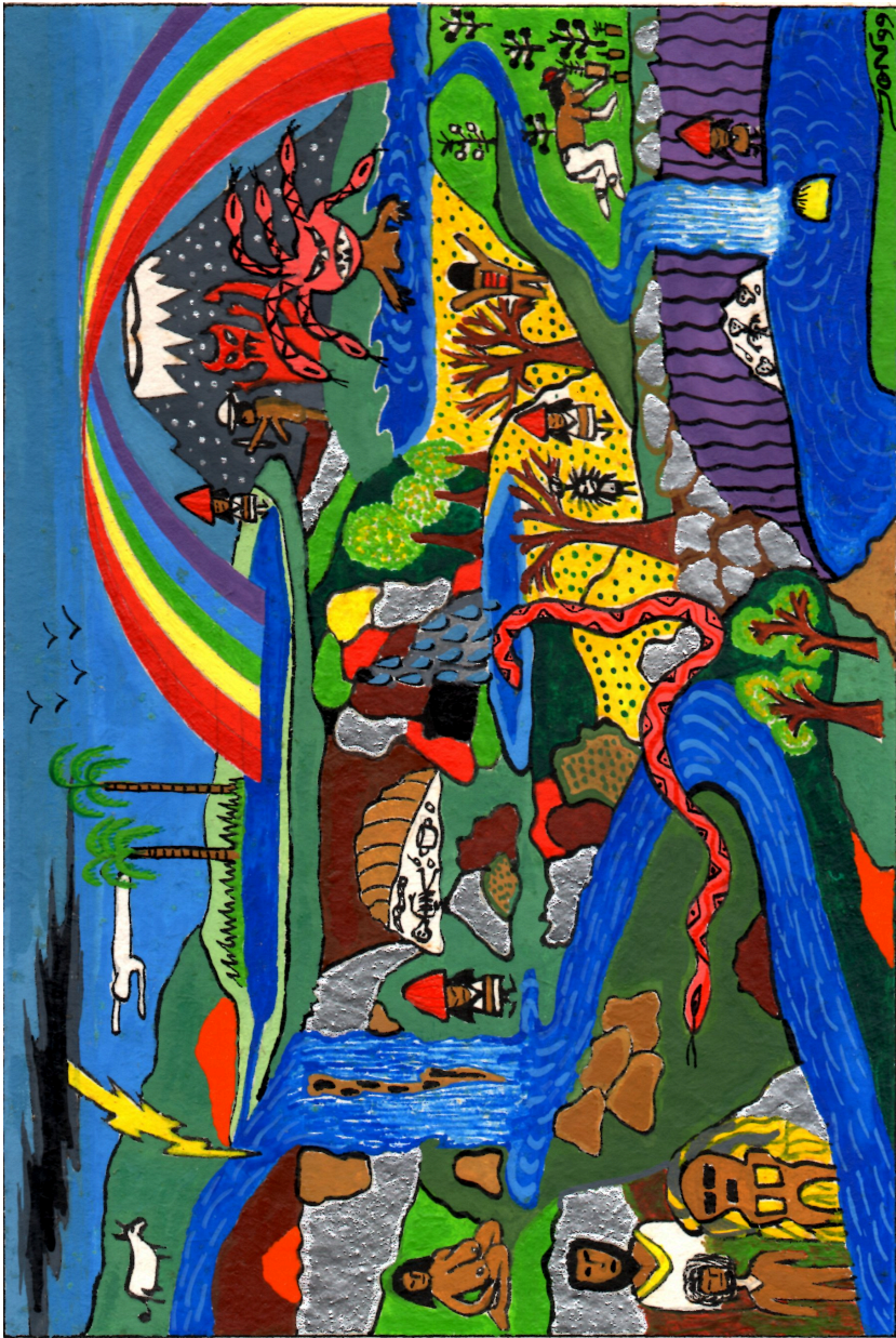
Dibujo 12: Los dueños del Agua

las plantas silvestres esconde o posibilita el encuentro de plantas medicinales. "Ella pierde su dominio cuando los humanos modifican la vegetación de una zona" (Faust 1988:47). Además, existen la madre agua, dueña de los ríos y lagunas con los peces que viven allí; la pantofo negra y blanca; el guando; y satanás, que vive en el volcán Puracé con "la gente mala" ya enunciada.