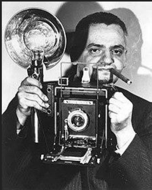
Arthur "Weegee" Fellig