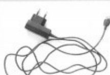
заря́дное устройство для моби́льного