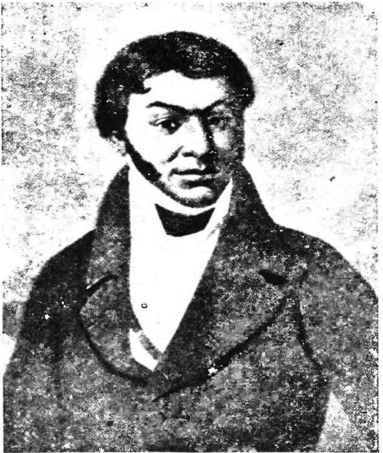
Григорій Квітка-Основ'яненко 1778—1843