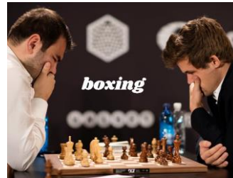
CHESS IS BOXING (dle Forceville 2016) – ŠACH (cíl) JE BOX (zdroj)