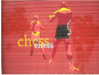
BOXING IS CHESS (Forceville 2016) – BOX (cíl) JE ŠACH (zdroj)