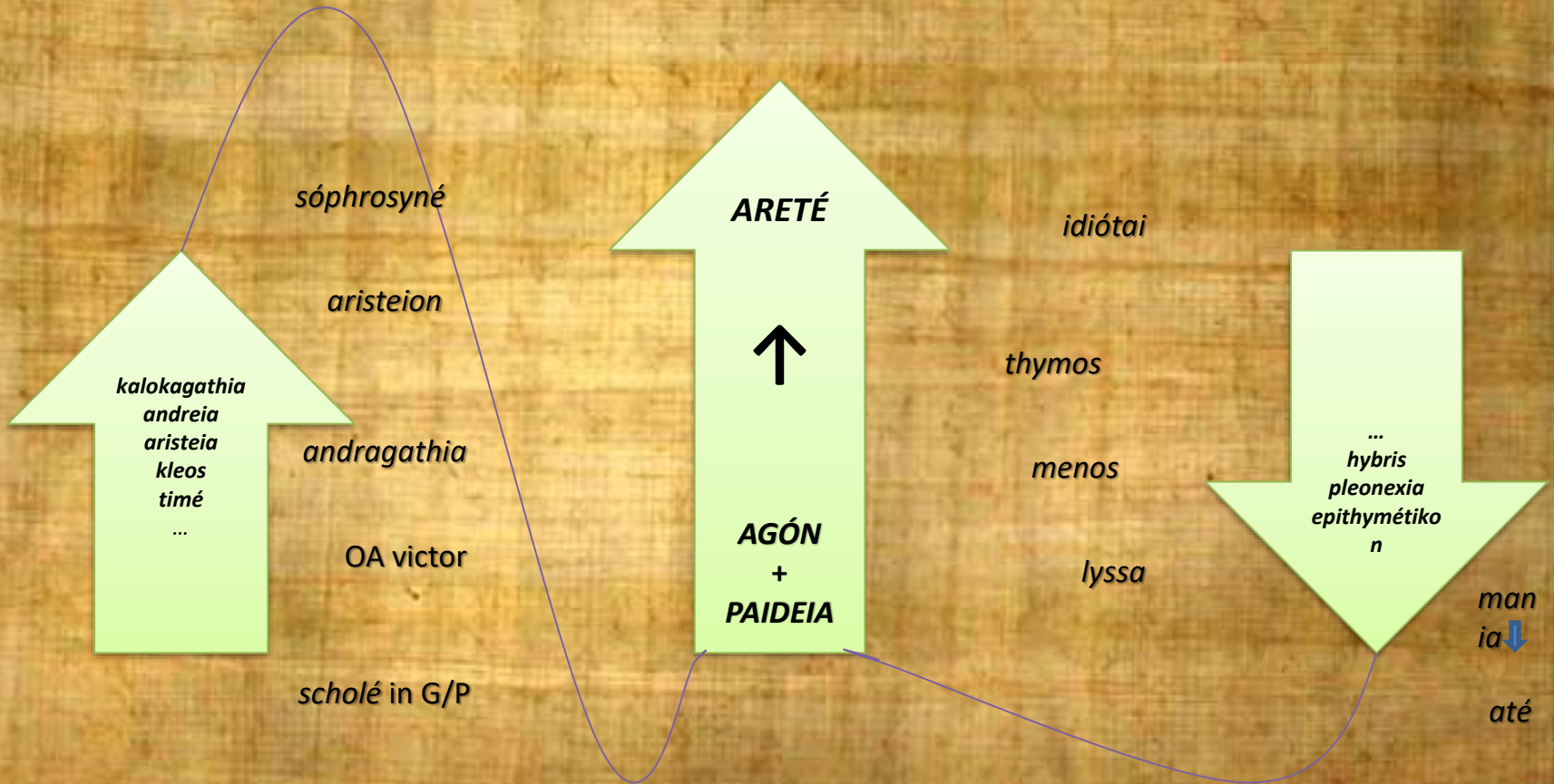
Diagram of the system of ideals of the Greek culture after the hoplite revolution through direct and inverse proportion