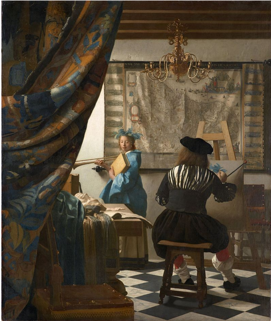
Jan Vermeer van Delft – Alegorie malířství