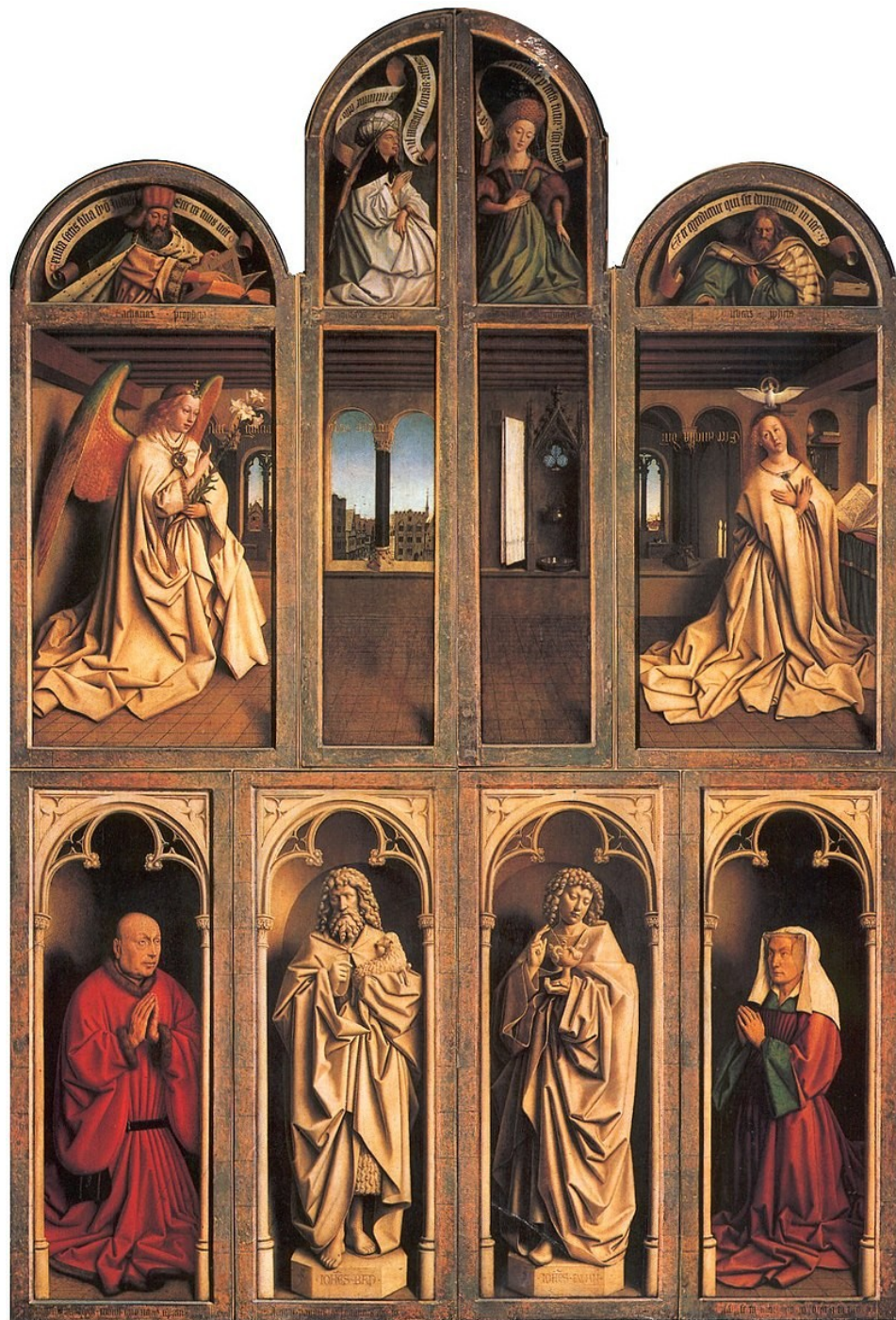
Jan a Hubert Eyckové – Gentský oltář