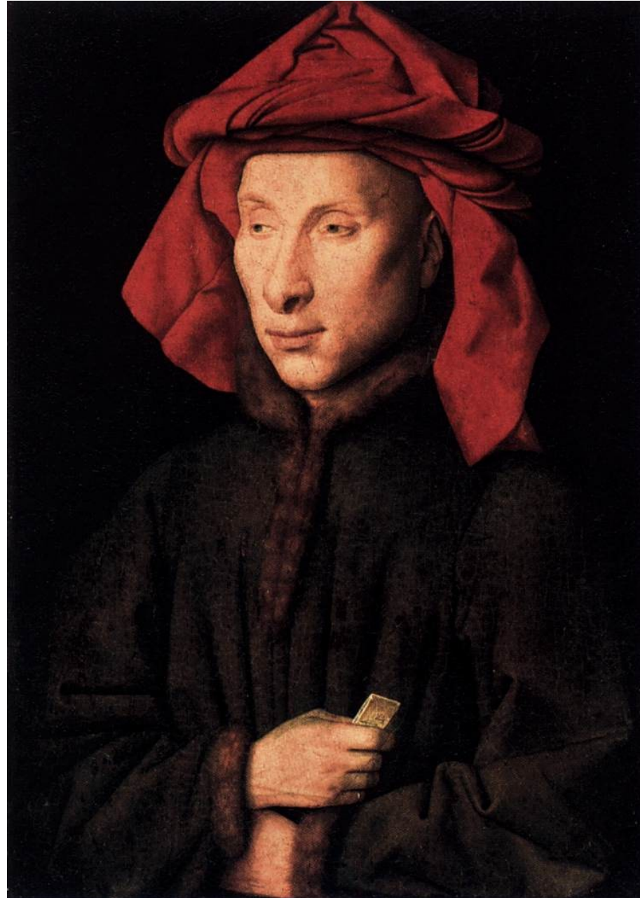
Jan van Eyck – Podobizny Giovanniho Arnolfiniho