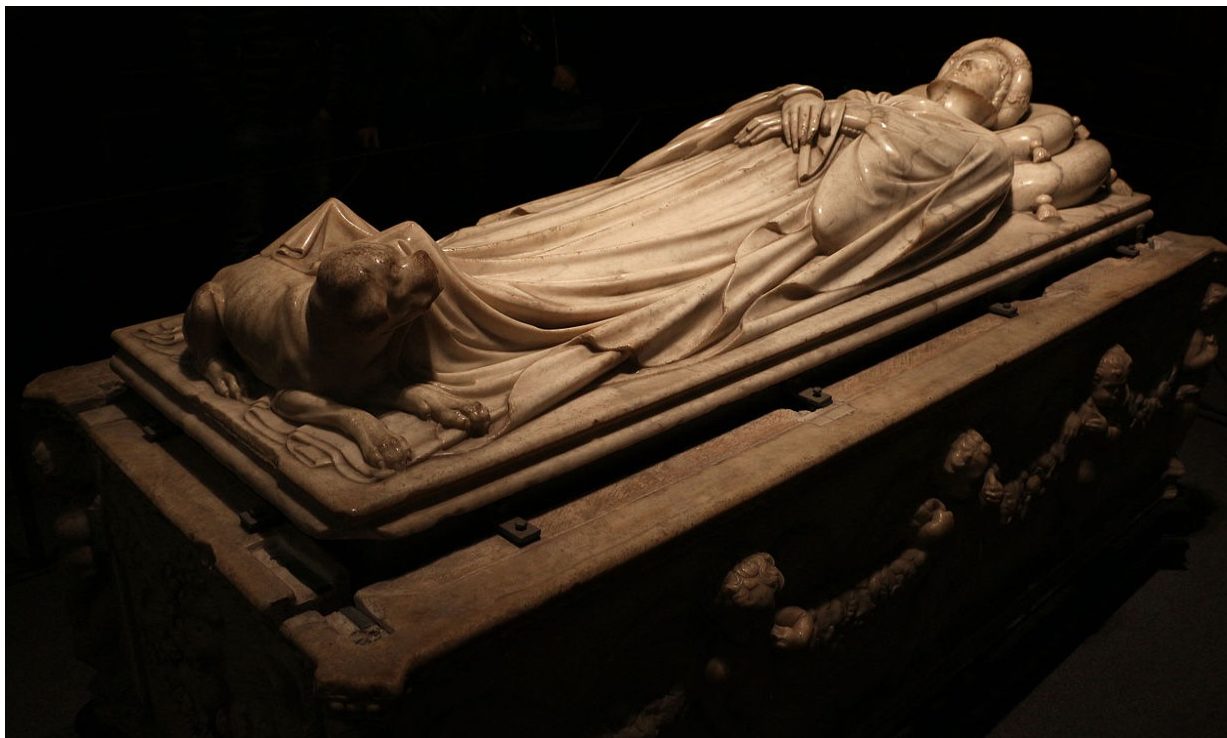
Náhrobek Ilarie del Carretto – Siena – Jacopo della Quercia (1406 – 1408)