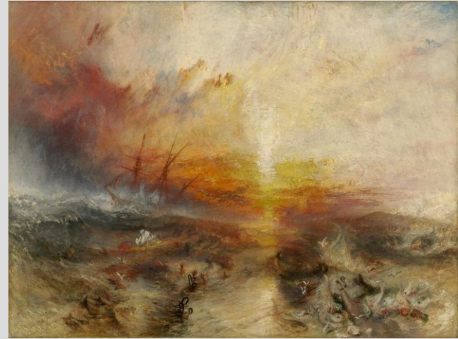
J. M. W. Turner, Otrokářská loď, 1840