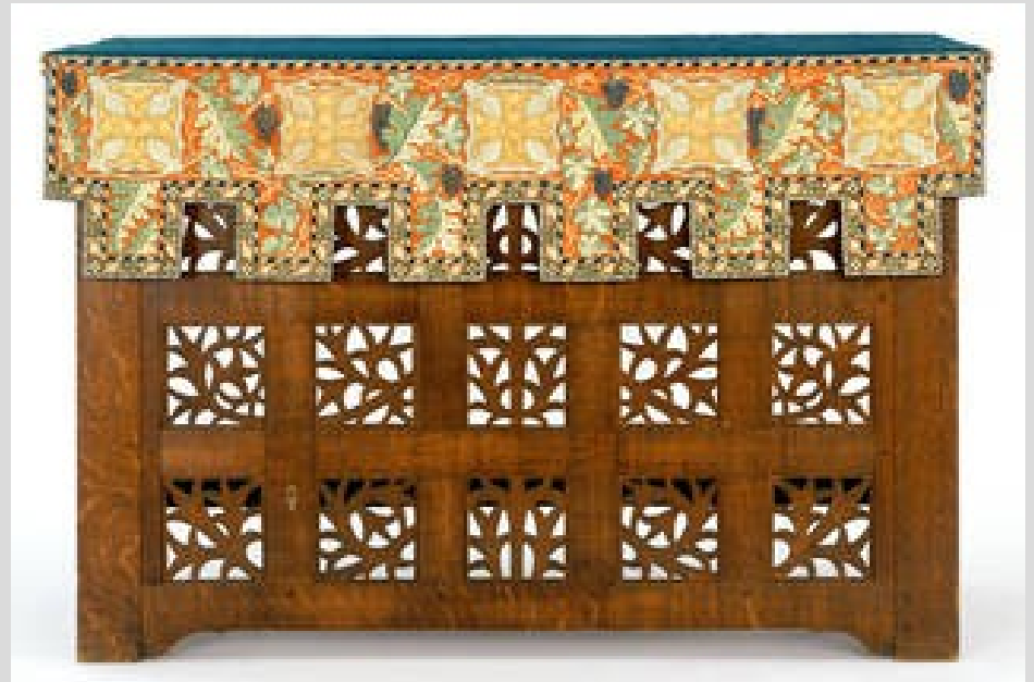
Oltář, návrh Phillip Webb, výroba John Garrett and Son, 1897, Anglie.