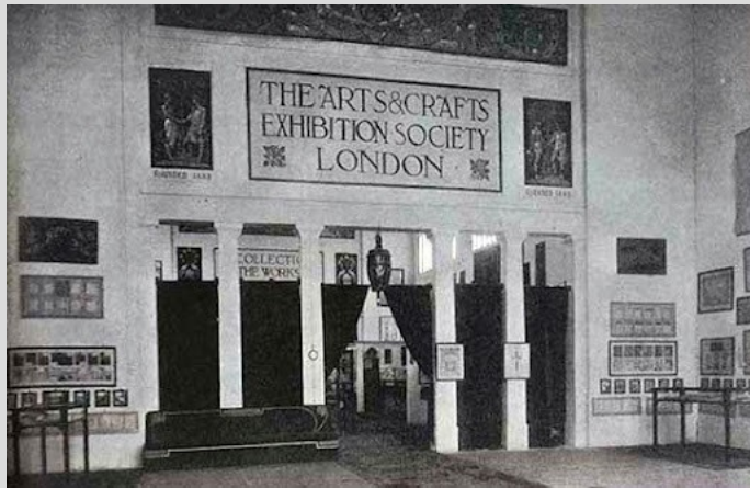
Výstavní společnost Arts and Crafts: výroční výstavy od r. 1888