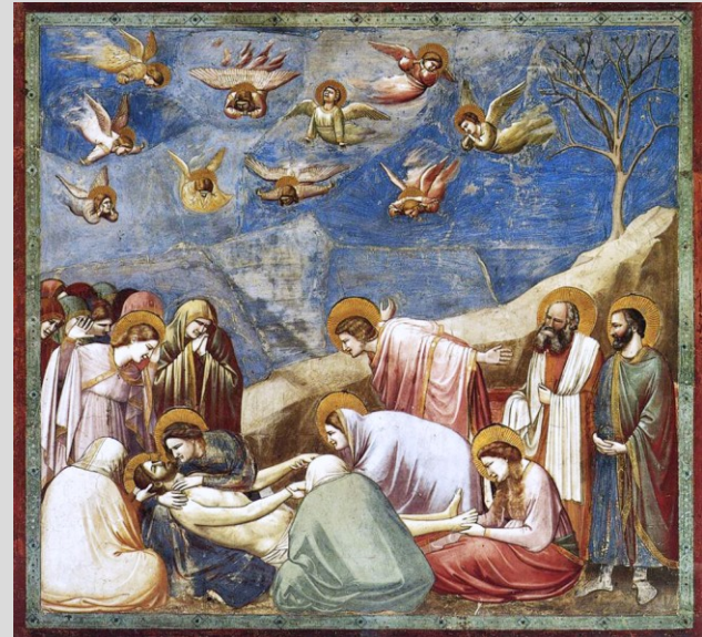
Giotto, Oplakávání Krista, 1305