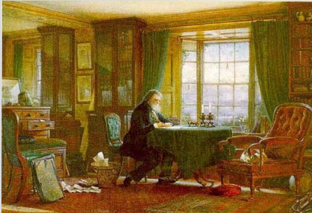
W. G. Collingwood, John Ruskin in his study, 1881