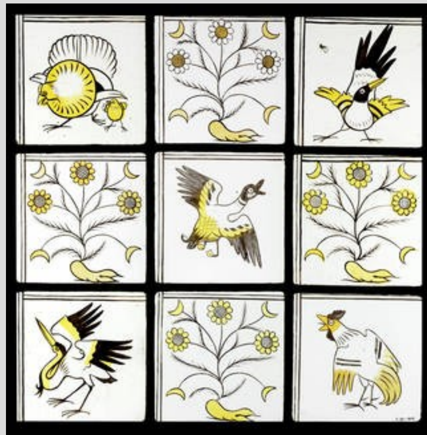
Panel, navržený Philipem Speakmanem Webbem, vyrobený James Powell & Sons, 1859 – 1860