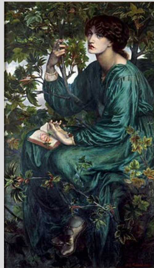
D. G. Rossetti, Snění, 1880