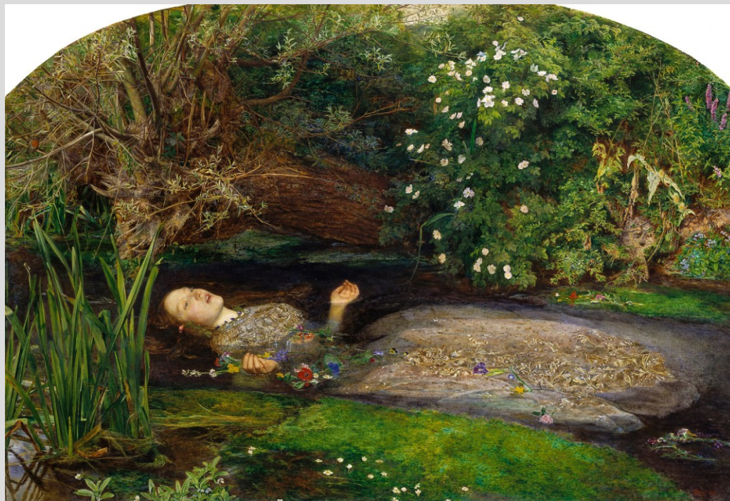
J. E. Millais, Ofélie, 1851-52