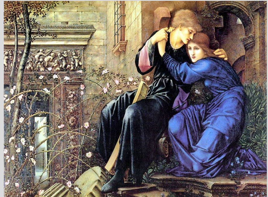
Lázka mezi ruinami, 1894