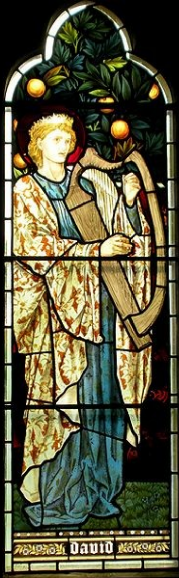
David, 1872, vitráž v kostele ve Waterfordu, Hertfordshire.