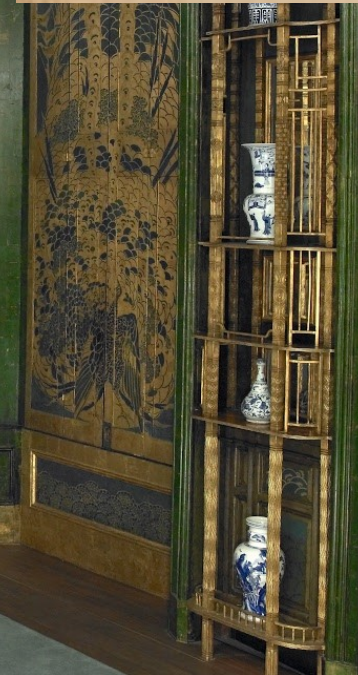
Paví pokoj, od J M Whistlera, 1876