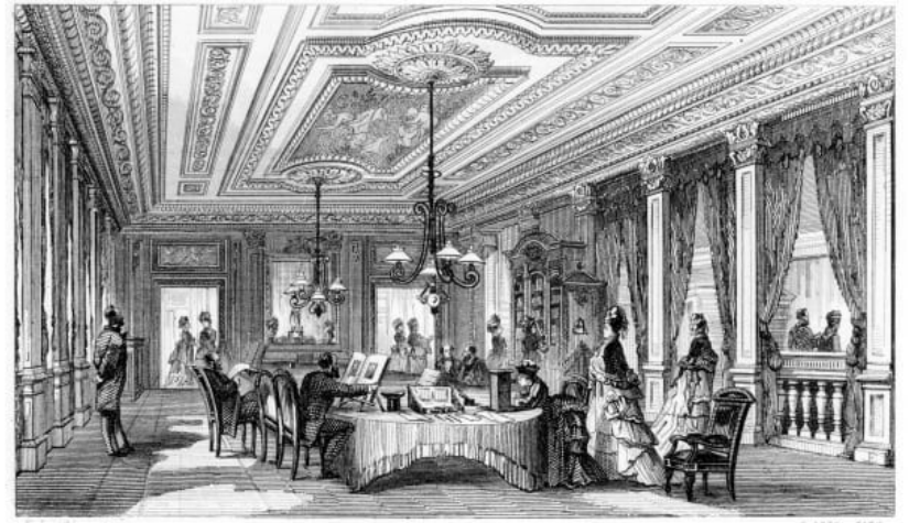
Le Bon Marché, Paříž