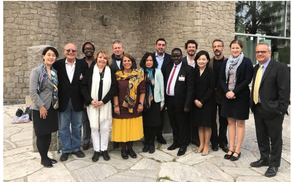
Evaluační orgán 2018