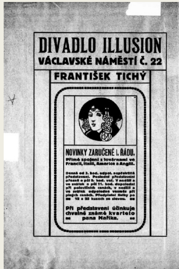
ČESKÝ KINEMATOGRAF (1911-1912) VYDÁVALA PŮJČOVNA PŘI KINĚ ILLUSION