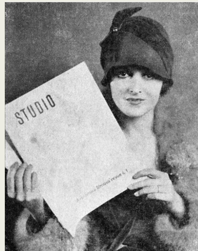
Propagační fotografie s americkou herečkou Mary Astor