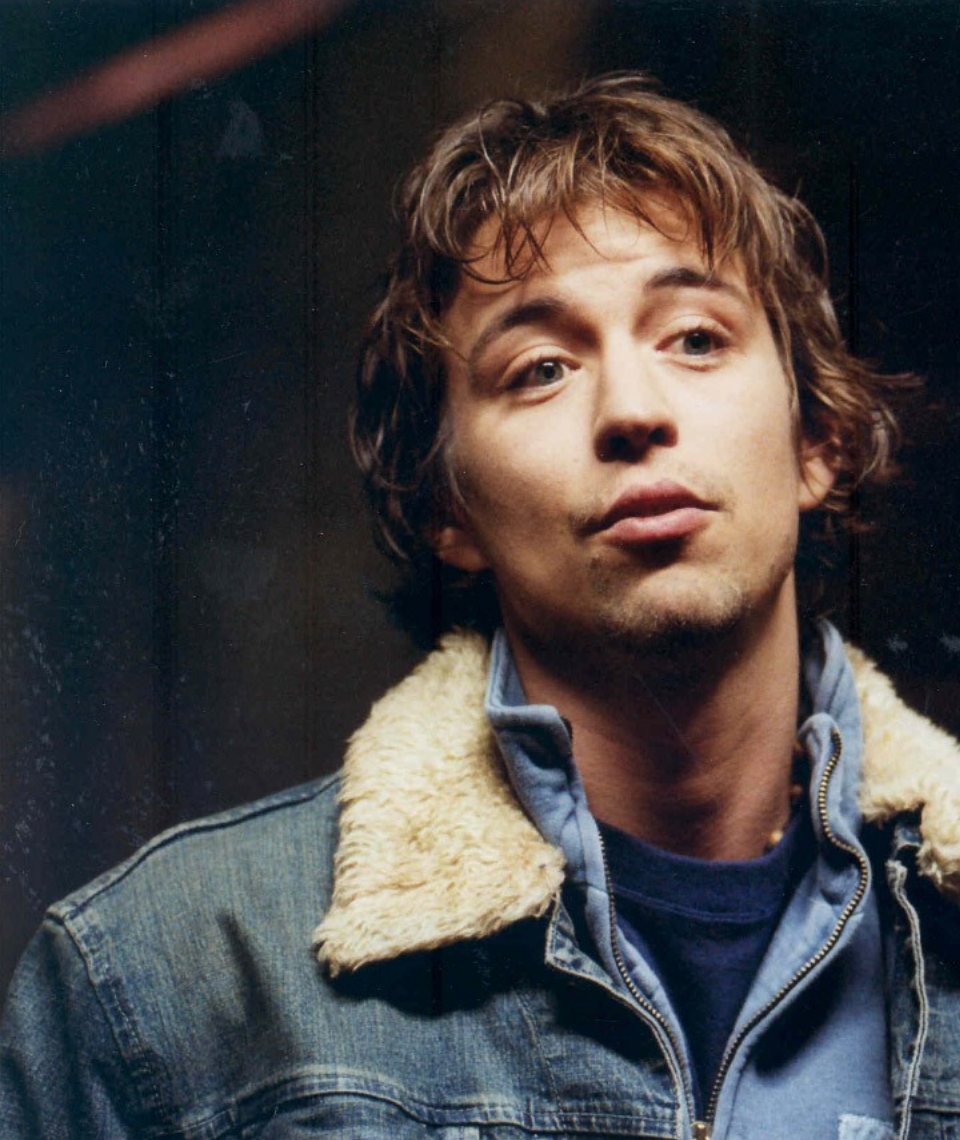
Sametoví vrazi (2005)