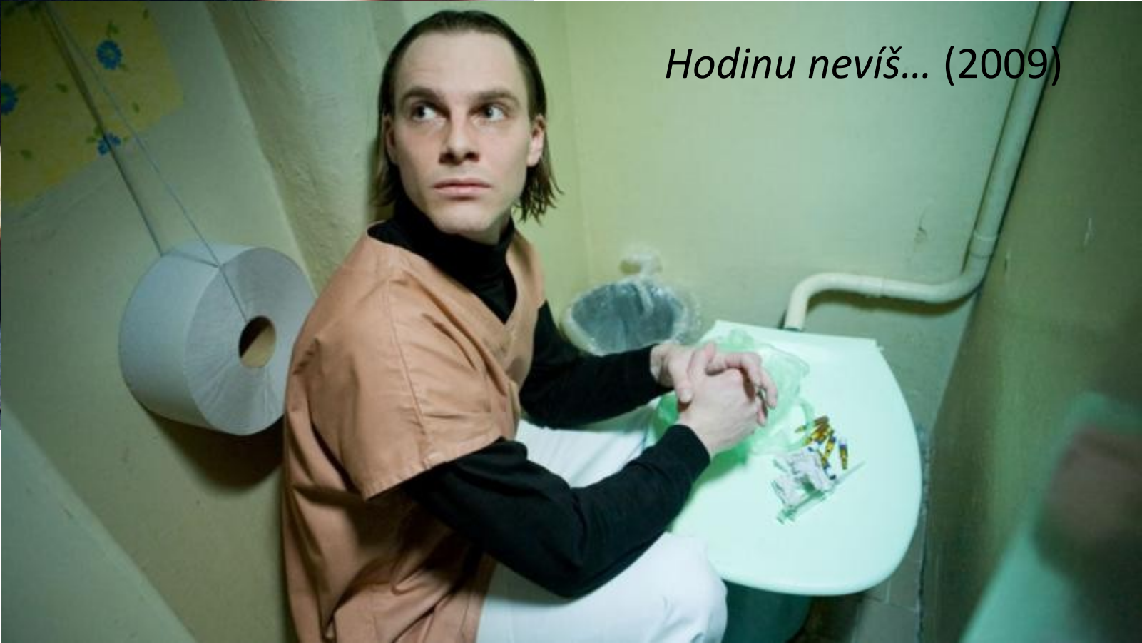
Hodinu nevíš... (2009)