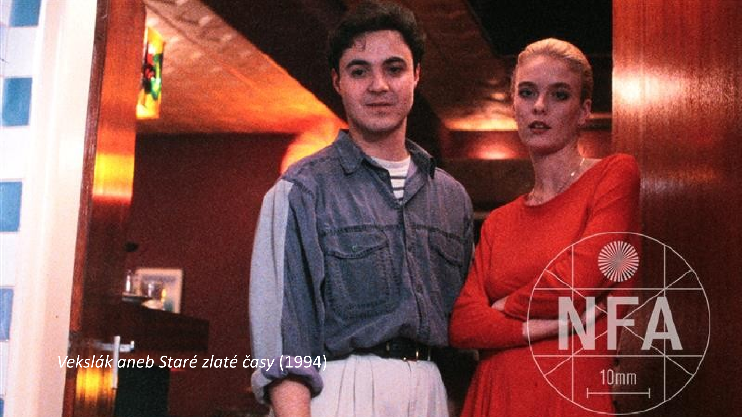
Vekslák aneb Staré zlaté časy (1994)