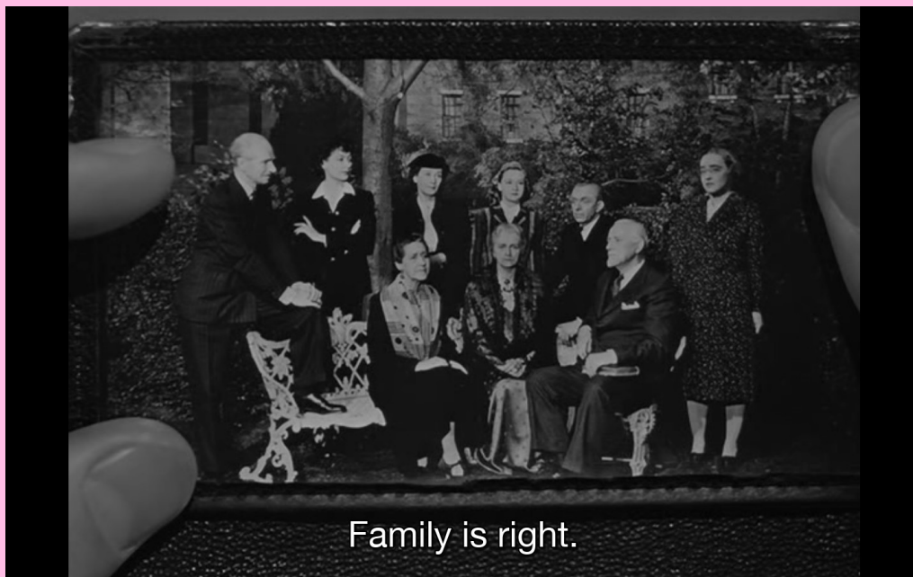
Family is right.