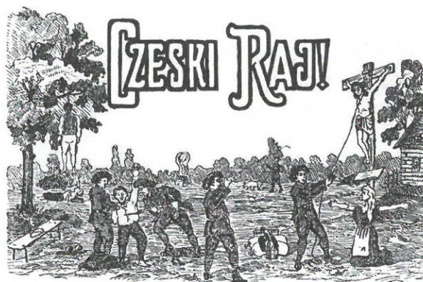
Protičeská polská agitace s vraždícími legionáři a hanobením kříže

S hospodářským rozvojem rostla také emancipace místních Čechů a Poláků, kteří se přirozeně začali dožadovat větších politických práv. Ta totiž z velké části náležela Němcům, kteří sice nebyli tak početní, patřili však k nejbohatší, a tím pádem i politicky nejvlivnější vrstvě. Češi a Poláci v Těšínském Slezsku proto spojili síly v zápase za zrovnoprávnění. S postupnými úspěchy ovšem začínala růst vzájemná rivalita, a tak od osmdesátých let 19. století mezi sebou obě etnika soupeřila o vliv v regionu. Polské národní hnutí bylo rozvinutější a mohlo těžit z blízkosti polských