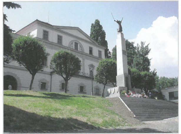
Pomník padlých Poláků v polském Těšíně

k jednacímu stolu. V roce 1947 se oba státy dohodly, že do dvou let budou všechny územní spory mezi nimi vyřešeny. Polsko totiž požadovalo tu část Těšínského Slezska obydlenou Poláky, Československo zase vznášelo nároky na území v bývalém německém Slezsku (Kladsko, Hlubčicko, Ratibořsko), které se po válce stalo součástí Polska. Nakonec však ani jedna strana žádné území nezískala. Hraniční smlouva, podepsaná 13. června 1958, znamenala definitivní tečku za sporem o Tě-