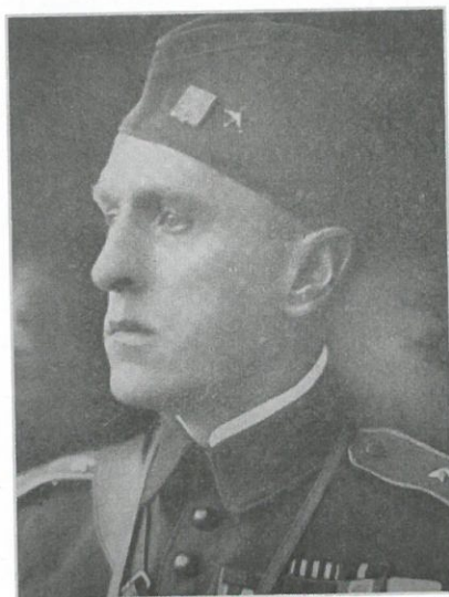
Podplukovník Josef Šnejdárek, velitel vojenského zásahu na Těšínsku

D ne 16. ledna 1919 se k ministru národní obrany československé vlády Václavu Klofáčovi dostal podplukovník Josef Šnejdárek (1875–1945). Tvrdý voják, bývalý příslušník francouzské cizinecké legie a bojovník srdcem i duší, si vyslechl pověření vojensky obsadit Těšínské Slezsko a vyhnat odtud Poláky. „Toto mé setkání s ministrem [...] bylo podkladem polního tažení, za kterého jsem do desíti dnů zatlačil polského generála Latini, dobyl Těšínska a získal pro republiku uhelné doly miliardové hodnoty,“ popisoval později v pamětech. Vojácky strohá slova v nezavěšeném čtenáři bezpochyby vyvolají pocit hrdosti nad československým vítězstvím. Úspěch v boji je však jedna věc a následky války druhá. Lze tedy skutečně mluvit o vítězství?