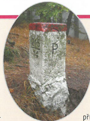
Hraniční kámen na česko-polském pomezí

šínské Slezsko. Při vytyčování hraniční čáry byly provedeny pouze malé úpravy s cílem vyřešit komplikace v dopravě, přístupu k polnostem či k napřímení hraniční čáry. Korektury proběhly na základě reciprocity, která však nebyla na československé straně dodržena. Z tohoto důvodu dnes Česká republika dluží Polsku 368 hektarů, přičemž jednání o vyrovnání tohoto územního dluhu, jenž však nemá nic společného se sporem o Těšínské Slezsko, stále probíhají.