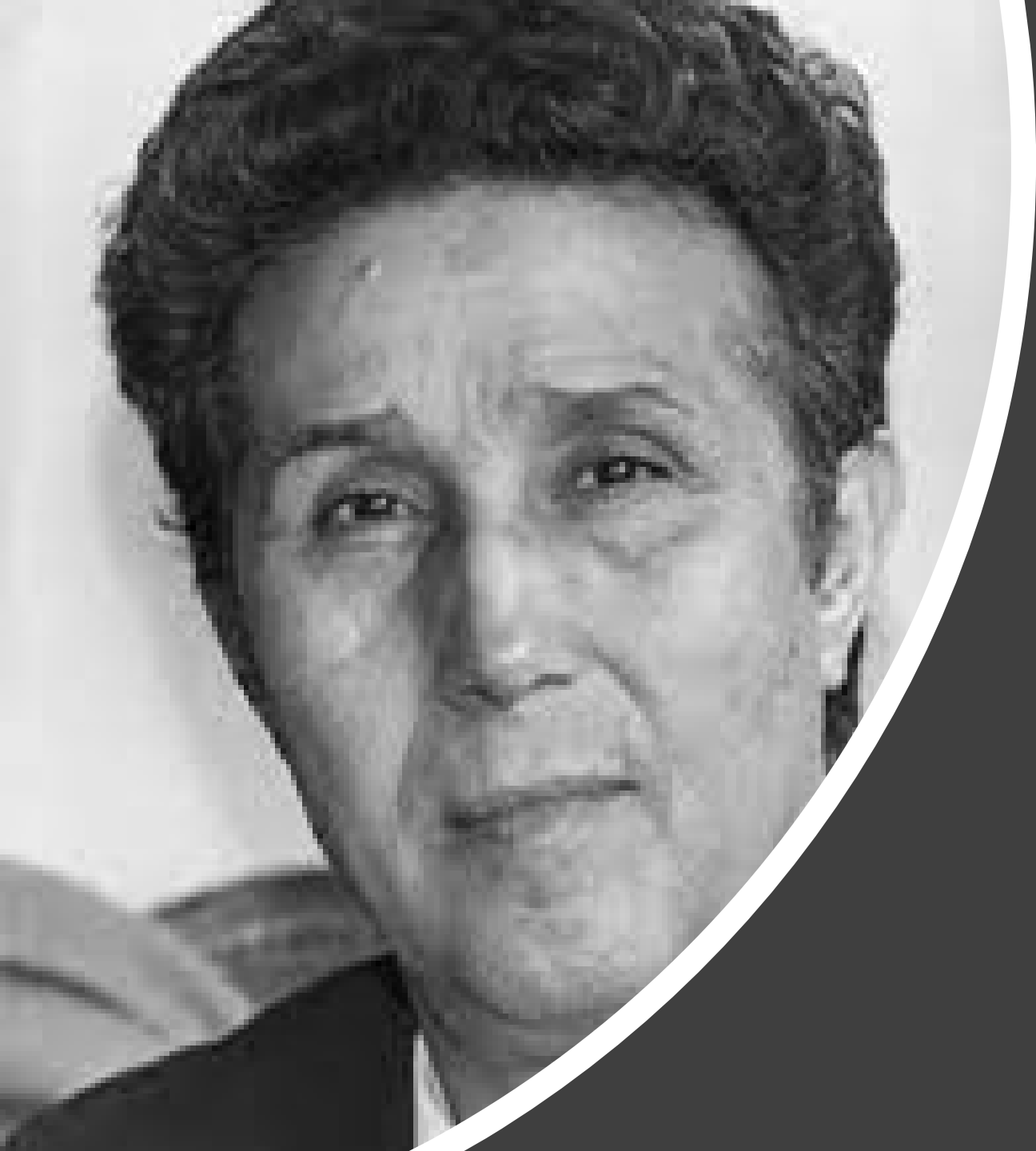
Ahmed Ben Bella