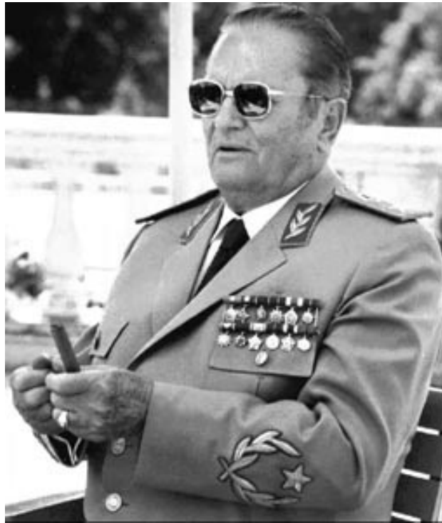
* Josip Broz - Tito