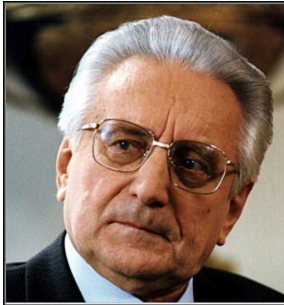
* Franjo Tudjman