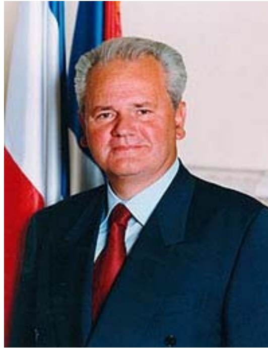
* Slobodan Milošević