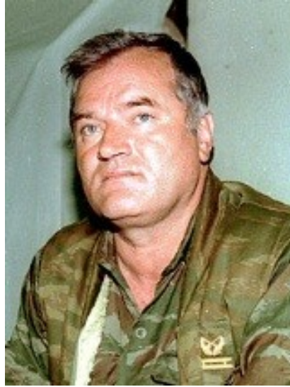
* Ratko Mladić