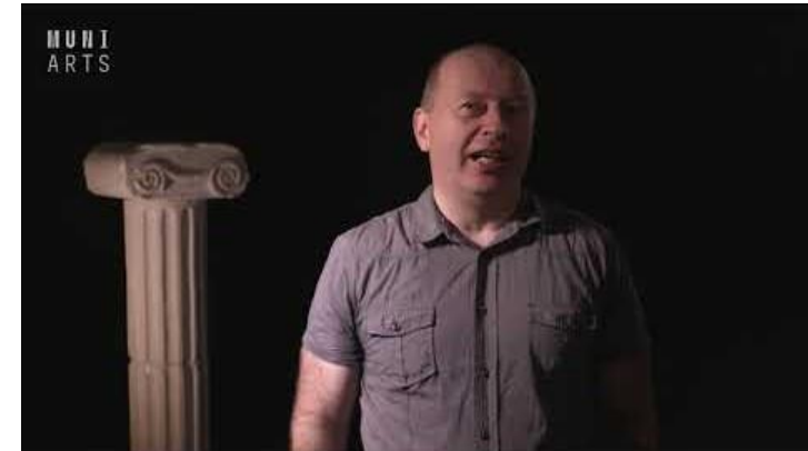
Scénka ilustrující Aristotelovu (a Platónovu) představu o tom, jak filosofie vznikla a co to vlastně je. Viz https://www.youtube.com/watch?v=RKA5R9iD2kc&t=7s

• „Neboť jako dnes, tak v dřívějších dobách lidé začali filozofovat, protože se něčemu divili. Z počátku se divili záhadným zjevům, jež jim bezprostředně ukazovala zkušenost, a teprve potom pohenáhu postupující naznačenou cestou dospěli i k záhadám významnějším... Ten pak, kdo pochybuje a diví se, má vědomí nevědomosti (...). Jestliže tedy lidé filozovali, aby unikli nevědomosti, je zjevno, že usilovali o vědění proto, aby nabyli vědění, nikoli pro nějaký vnější užitek. (...) A tak vidíme, že tuto vědu [tj. filosofii] nevyhledáváme pro žádný jiný vnější užitek, nýbrž jako říkáme, že svobodný je člověk, jenž je pro sebe a nikoli pro druhého, tak i ona jenom je vědou svobodnou; jenom ona totiž je vědou pro sebe.“