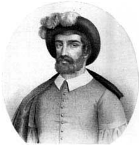
Juan Sebastián Elcano (1476-1526)