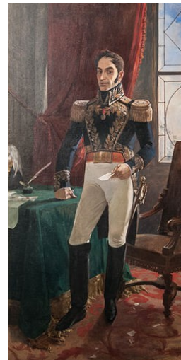
Simón Bolívar (1783-1830)