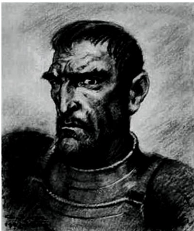
Lope de Aguirre (1510-1561)