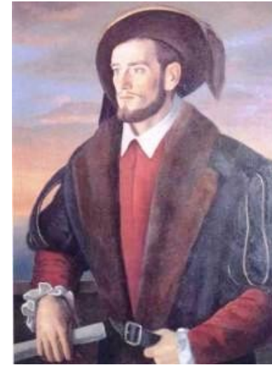
Andrés Urdaneta (1508-1568)