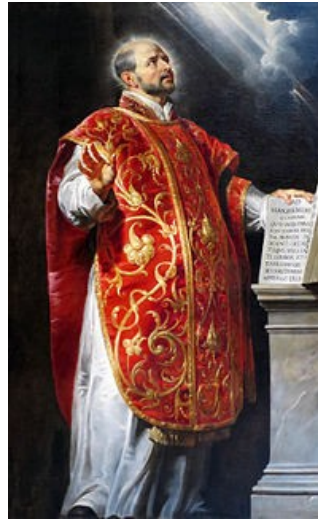
Ignacio de Loyola (1491-1556)