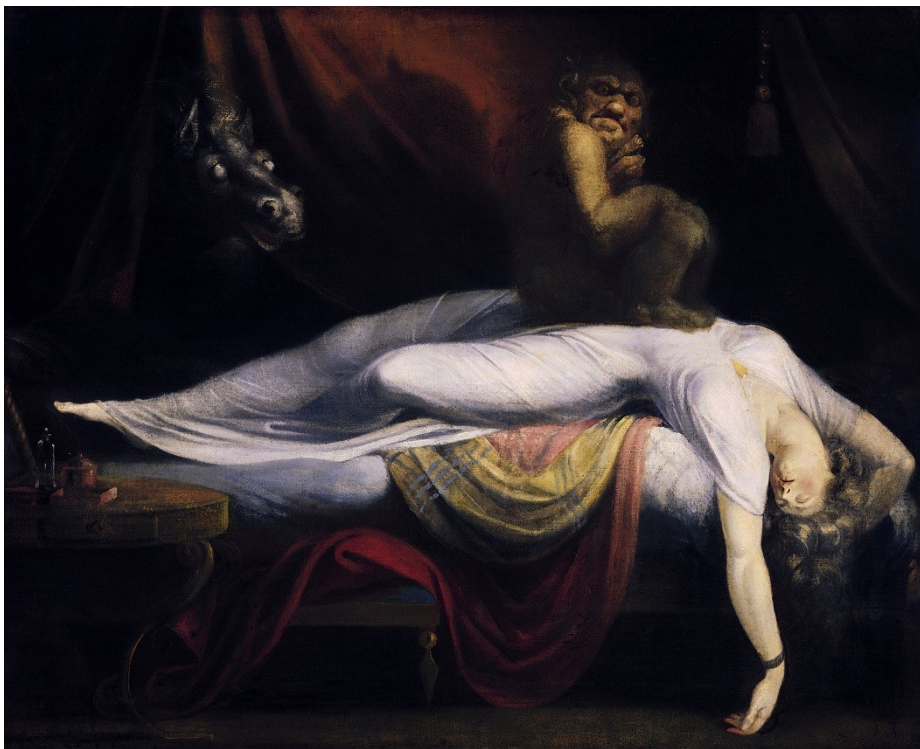
Johann Heinrich Füssli, Noční můra, 1781