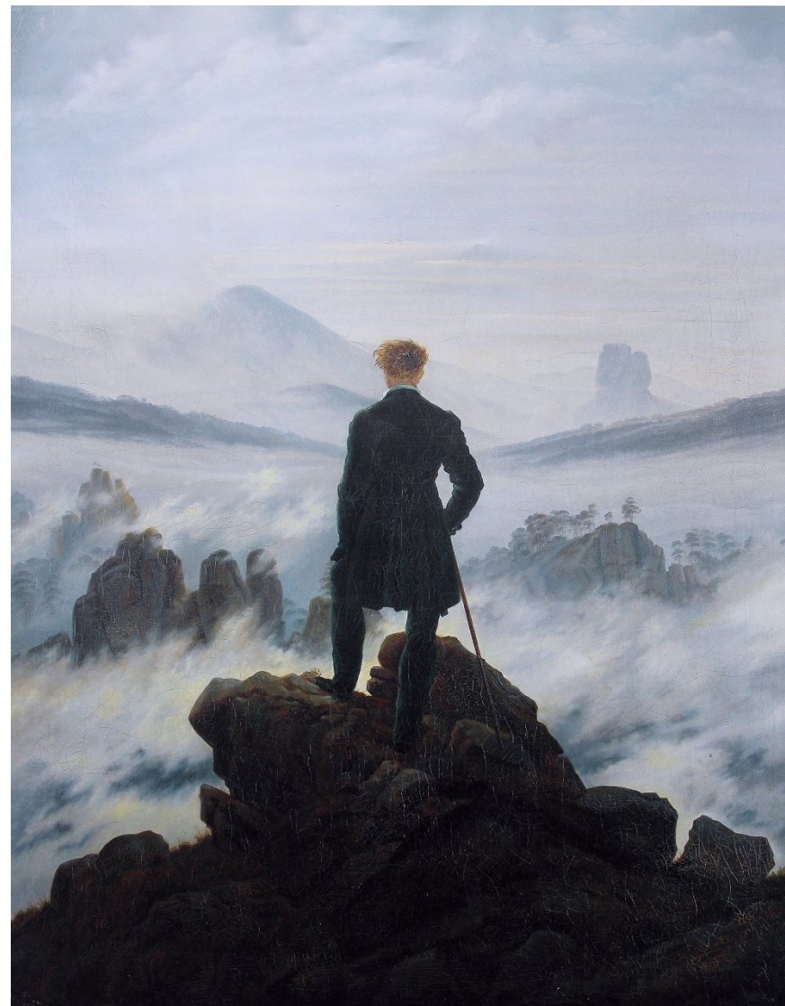
Caspar David Friedrich, Poutník nad mořem mlh, cca 1817