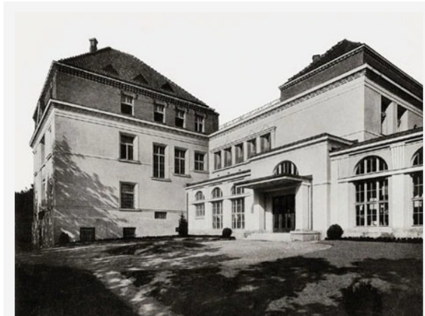
Lemberger-Gombrich villa in Vienna, 1913-1915.