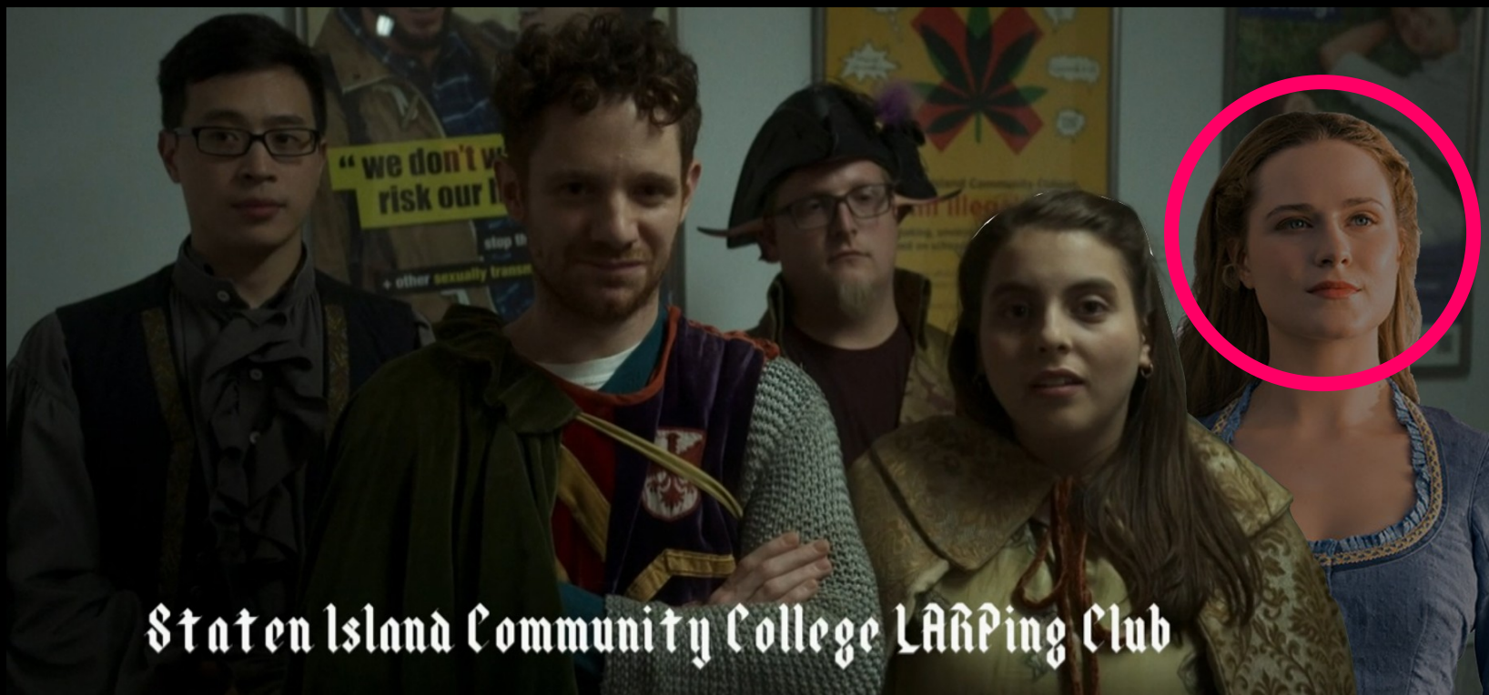
Staten Island Community College LARPing Club