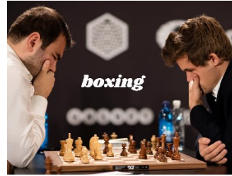
CHESS IS BOXING (dle Forceville 2016) – ŠACH (cíl) JE BOX (zdroj)