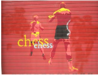
BOXING IS CHESS (Forceville 2016) – BOX (cíl) JE ŠACH (zdroj)