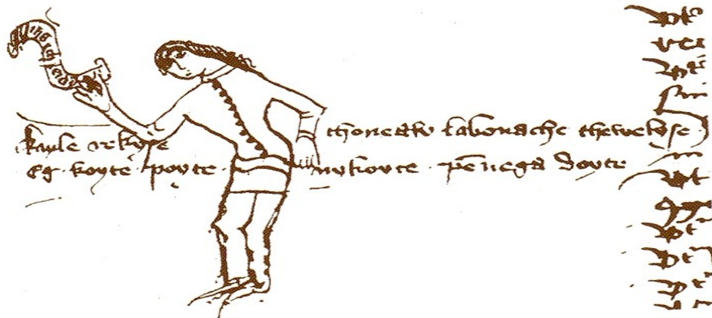
XIV A. II P. PRŪSIŠKAS ĮRAŠAS

Kayle rekylse thoneaw labonache thewelys Eg koyte poyte nykoyte penega doyte