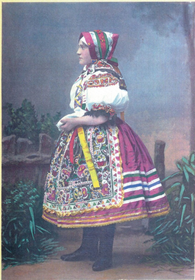
Chorvatské děvče z Nového Prerova. Kroatisches Mädchen aus Nen-Preran.