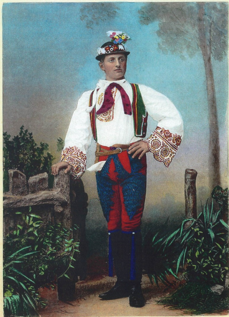
Chorvatský junák z Nového-Prerova. Kroatischer Bursch aus Nen-Preran.